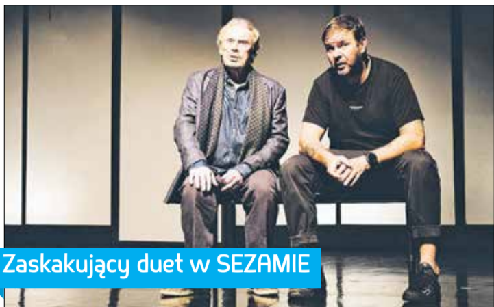
Zaskakujący duet w SEZAMIE