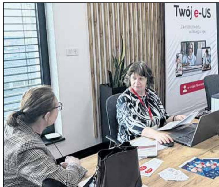
Eksperci Urzędu Skarbowego Poznań-Jeżyce pomogą rozliczyć PIT.

Przypominamy także o możliwości przekazania 1,5% podatku wybranej organizacji pożytku publicznego. Mogą to zrobić również emeryci, za