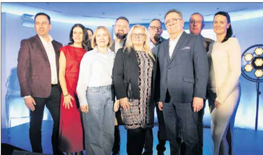
Przedstawiciele z gminy Tarnowo Podgórne.