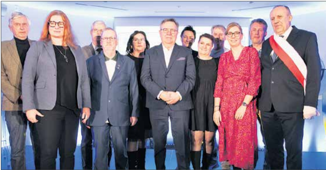
Przedstawiciele z gminy Kórnik.