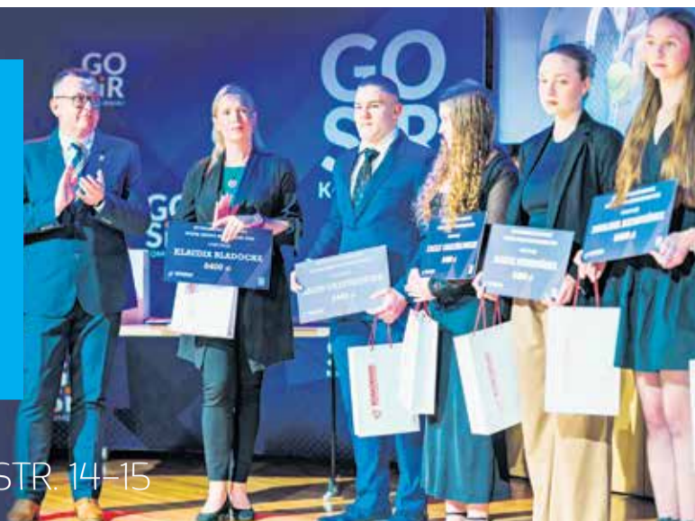
I Gala Sportu Gminy Komorniki. STR. 14-15