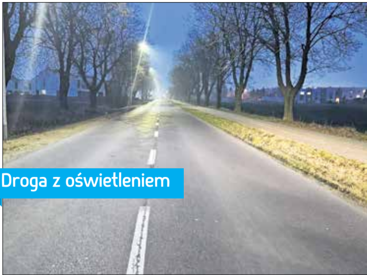
Droga z oświetleniem

Nowe oświetlenie drogi Kostrzyn – Strumiany już działa, poprawiając bezpieczeństwo i komfort mieszkań-