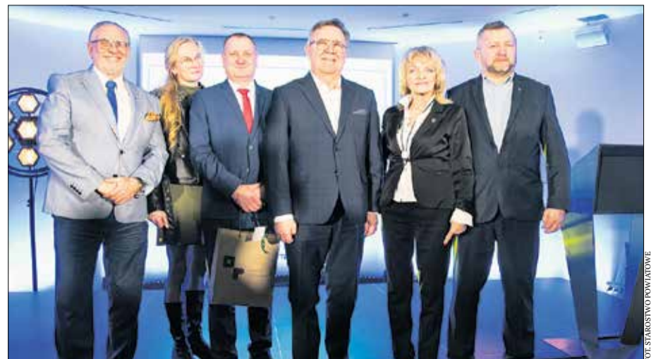
Przedstawiciele z gminy Murowana Goślina.