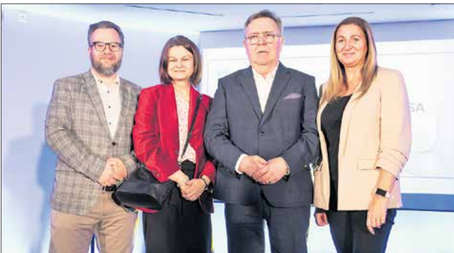
Przedstawiciele z gminy Czerwonak.