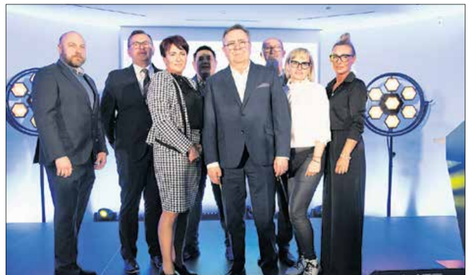
Przedstawiciele z gminy Komorniki.