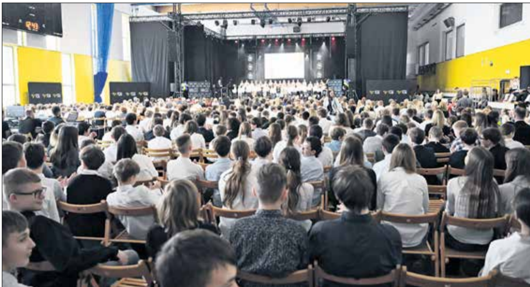
W hali widowiskowo-sportowej zgromadziła się cała społeczność szkolna.