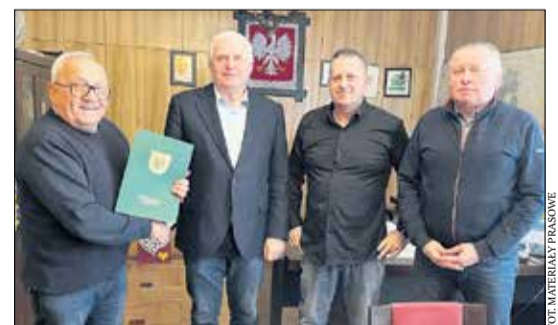
K. S. „Lipno” Stęszew.

Organizacje pozarządowe i grupy zrzeszone działające na terenie gminy Stęszew odgrywają kluczową rolę w życiu społecznym, kulturalnym i sportowym. Dzięki ich zaangażowaniu mieszkańcy mogą korzystać z wielu wartościowych inicjatyw i wydarzeń.