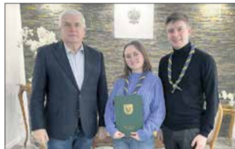
ZHP Chorągwie Wielkopolska Hufiec Nowy Tomyśl.