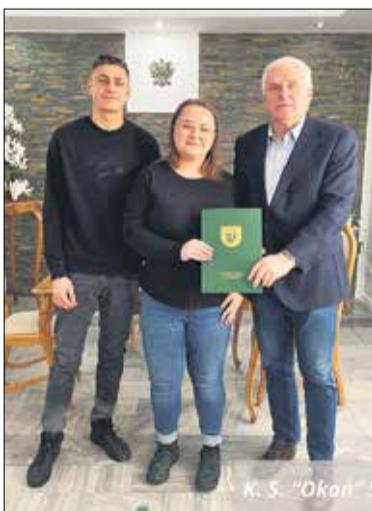
K. S. „Okoń” Sapowice.