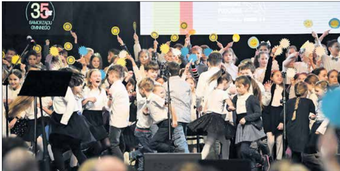
Na scenie nie brakowało radosnych uczniowskich prezentacji.