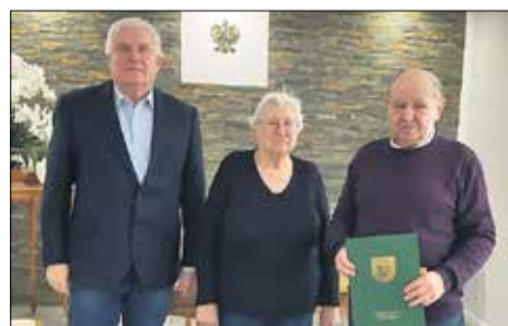
Stowarzyszenie Na Rzecz Osób Niepełnosprawnych PROMYK.