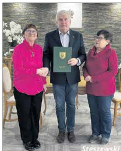
Stęszewski Uniwersytet Trzeciego Wieku.