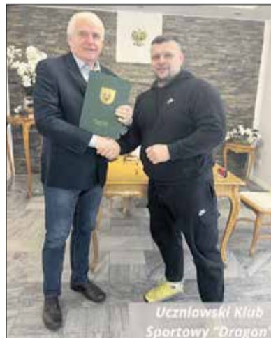
Uczniowski Klub Sportowy „Dragon”.