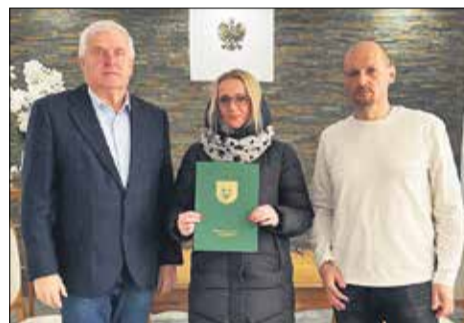
K. S. „Spójnia” Strykowo.