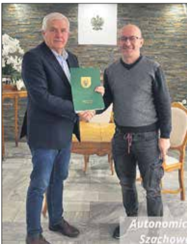
Autonomiczna Sekcja Szachowa „Lipno”.