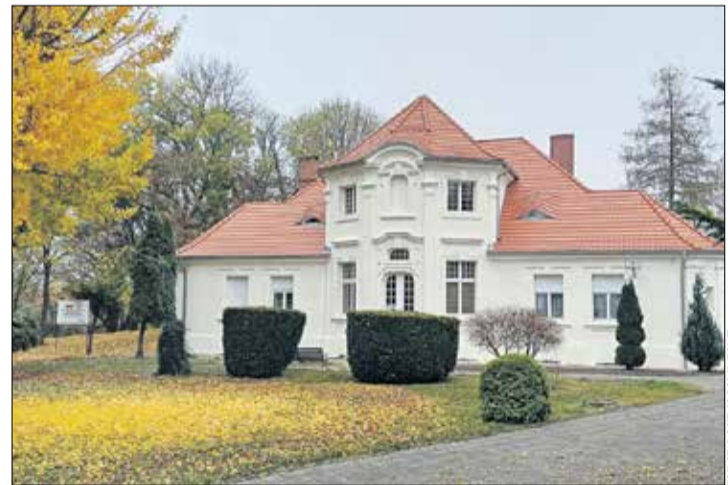
Plebania w Kórniku-Bninie.

Tylko w 2024 r. z przyznanych środków skorzystało 35 obiektów, w tym aż 19 historycznych kościołów. Pomoc dostały także instytucje kultury i nauki, budynki prywatne, jak wille, domy mieszkalne czy pałace. W ostatnich 26 latach samorząd na renowację wydał oszałamiającą kwotę blisko 21 mln zł, a wsparcie trafiło do prawie 97 podmiotów.