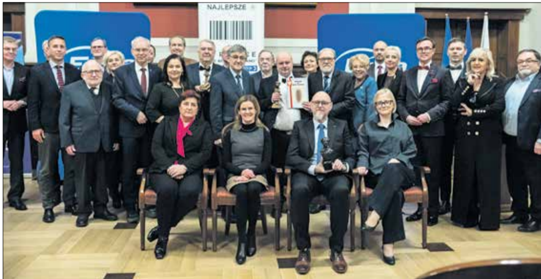
Laureaci, kapituła i goście gali „Najlepsze w Polsce” – „The Best in Poland”.

„Najlepsze w Polsce – The Best in Poland” to jeden z najważniejszych certyfikatów dla usług i produktów w naszym kraju, a bycie jego laureatem otwiera wiele drzwi – potwierdzali uczestnicy 37. Gali Konsumenckiego Konkursu Jakości Produktów i Usług „Najlepsze w Polsce” i laureaci 41. edycji Konkursu. Organizatorem było Towarzystwo im. Hipolita Cegielskiego. Partnerem głównym gali – firma Enea. Partnerami były firmy: ATANER i PROMAG S.A.