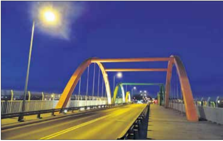
Wiadukt w Jasinie.

Jeszcze w tym roku rozpocznie się budowa obwodnicy Swarzędza. Wojewoda wielkopolska właśnie opublikowała listę inwestycji, które mogą liczyć na wsparcie w ramach Rządowego Funduszu Rozwoju Dróg na 2025 rok. Powiat poznański otrzyma dofinansowanie połowy kosztów powstania nowej trasy szacowanych na blisko 33 mln złotych.