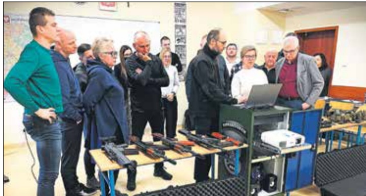
Szkolenie w zakresie obsługi wirtualnej strzelnicy.

Utworzenie strzelnicy możliwe było dzięki dofinansowaniu pozyskanemu ze środków Ministra Obrony Narodowej w ramach programu „Strzelnica w powiecie 2024”.