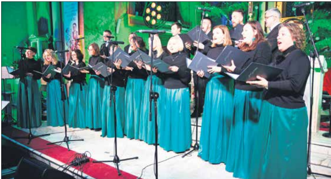
Zespół Kameralny Amici Canti.