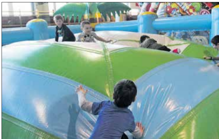
OSIR Tarnowo Podgórne zaprasza od 20 do 23 stycznia na bezpłatne dmuchańce.

O gminie Tarnowo Podgórne czytaj także na naszglaspoznancki.pl