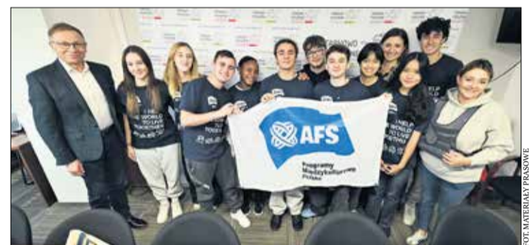
FOT. MATERIAŁY PRASOWE

W tym roku do Wielkopolski przyjechało 7 zagranicznych uczniów, z czego 4 do gminy Tarno-