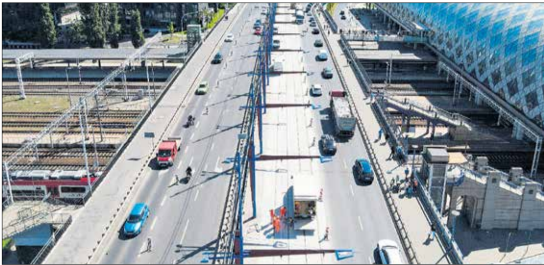
Dwa tygodnie wcześniej niż zakładano zakończyły się remonty torowisk w rejonie mostu Dworcowego i ronda Starołęka.

Bardzo dobra wiadomość dla pasażerów: dwa tygodnie wcześniej niż zakładano zakończyły się remonty torowisk w rejonie mostu Dworcowego i ronda Starołęka. Dzięki temu już od poniedziałku, 19 sierpnia, powróciły tam tramwaje