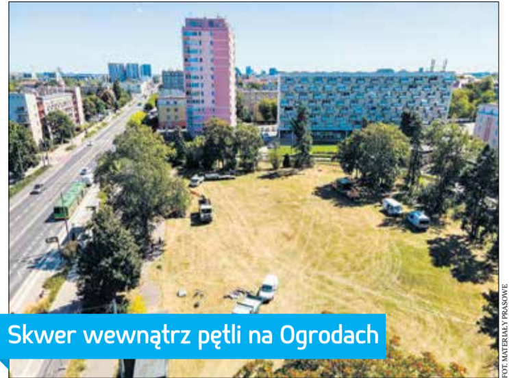
Skwer wewnątrz pętli na Ogrodach

W miejscu zaniedbanego dotychczas terenu pośrodku pętli na Ogrodach powstanie ogólnodostępny skwer. Zostaną na nim zasadzone 24 nowe drzewa, pojawią się również liczne rabaty z kwiatami, krzewy, byliny oraz trawy ozdobne. Efektem rozpoczętych właśnie prac będą m. in. alejki wśród zieleni, ławki, na których będzie można odpocząć oraz nowe dojście do przystanków tramwajowych. Inicjatorem powstania skweru jest Rada Osiedla Ogrody, a projekt realizuje Zarząd Transportu Miejskiego w Poznaniu.