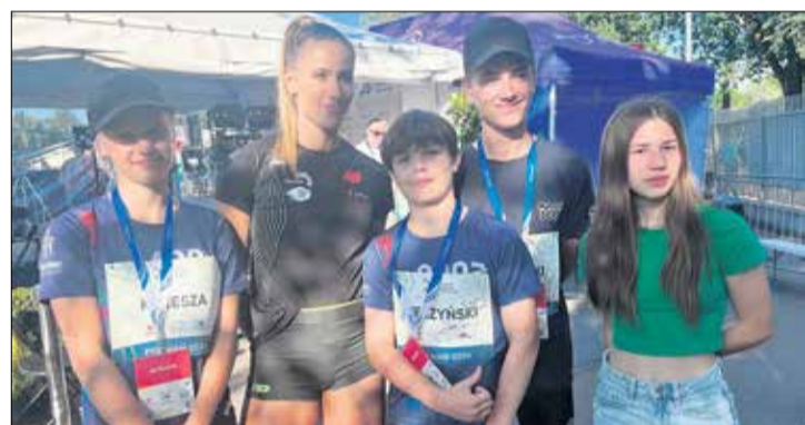
Projekt współfinansowany ze środków gminy Tarnowo Podgórne.