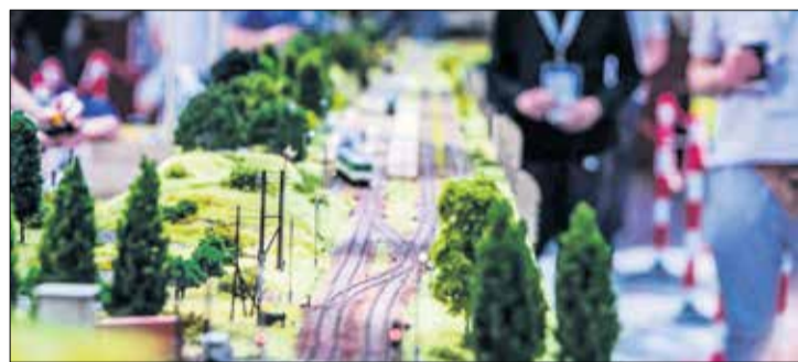
Wśród wakacyjnych propozycji jest zaproszenie na wystawę makiet kolejowych – 27-30 lipca w Centrum Demokracji i Integracji Obywatelskiej w Tarnowie Podgórnej.

Lista propozycji na pierwszą część wakacji (ok. 150 wydarzeń!) jest dostępna na plakatach i stronie internetowej gminy www.tarnowo-podgorne.pl . Za chwilę ukaże się część druga – sierpniowa – tak, by jak najszybciej mieszkańcy mogli zapełnić swój wakacyjny kalendarz. Rz