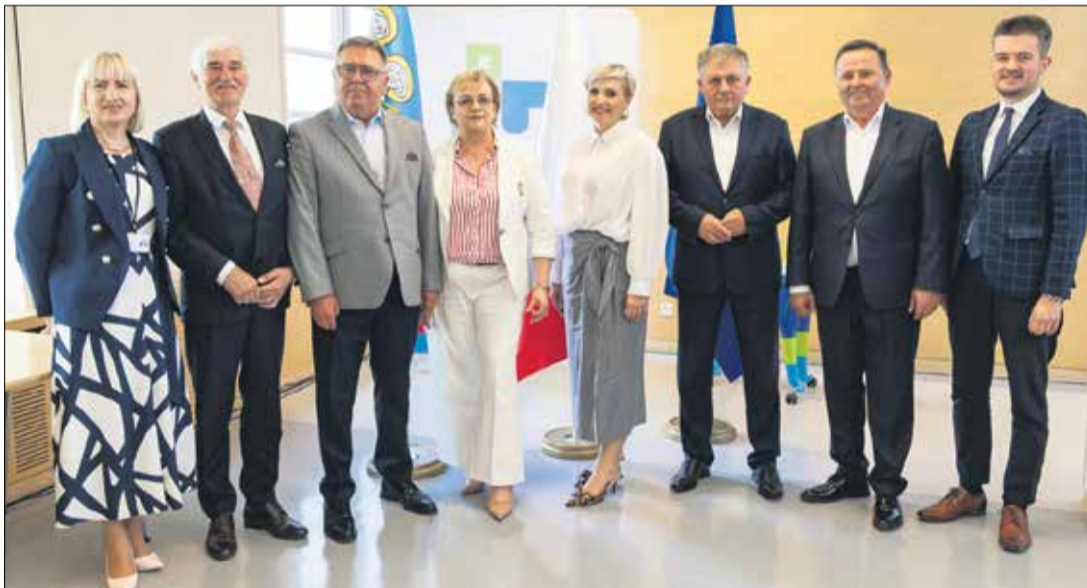
Radni poparli Zarząd bez głosu sprzeciwu.

ły na ulicy Szamotulskiej w Rokietnicy, jedno w Siekierkach Wielkich. Zbudowano m.in. chodniki, zjazdy