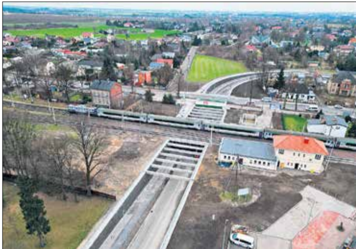
Tunel w Kobylnicy.

Na drugim miejscu znalazły się wydatki na drogi (113 mln zł). 83,5 mln zł kosztowały inwestycje, remonty prawie 8,6 mln zł i blisko 4,4 mln zł wykupy gruntów. Największym wyzwaniem była budowa tunelu pod torami kolejowymi w Kobylnicy sfinansowana z budżetu powiatu poznańskiego, gminy Swarzędz oraz PKP. Dwa ronda powsta-