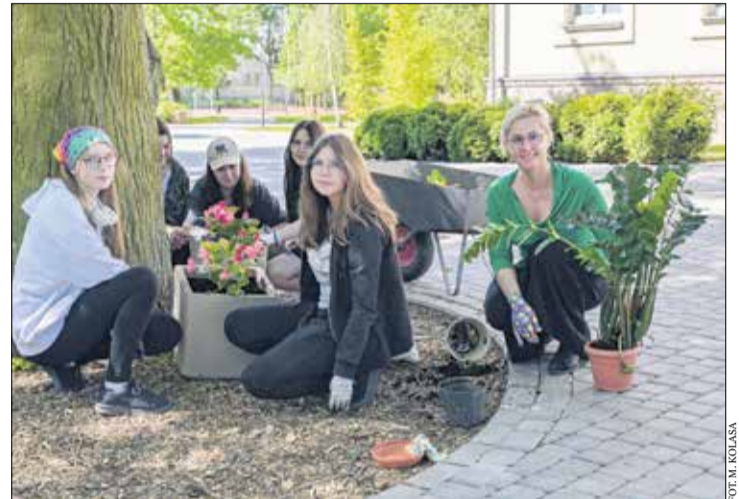
Zagospodarowano m.in. teren ZS w Rokietnicy.