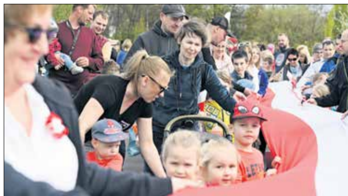
Z okazji Święta Flagi, podczas pikniku w Parku 700-lecia w Tarnowie Podgórny zapraszamy do wspólnego zdjęcia z biało-czerwoną flagą!

Wszystkie wydarzenia, zaplanowane w ramach obchodów 20-lecia obecności Polski w Unii Europejskiej, znajdują się na gminnej stronie internetowej www.tarnowo-podgorne.pl . ARz