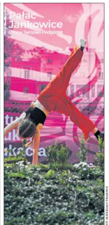
Na Festiwalu w Pałacu Jankowice mieszkańcy prezentują swoje zainteresowania i umiejętności, m.in. artystyczne, sportowe, kulinarne.

Osoby zainteresowane udziałem w targach w roli wystawcy, mogą zgłaszać się pod adresem: palac.jankowice@tarnowo-podgorne.pl . ARz (na podst. mat. Pałac Janowice)