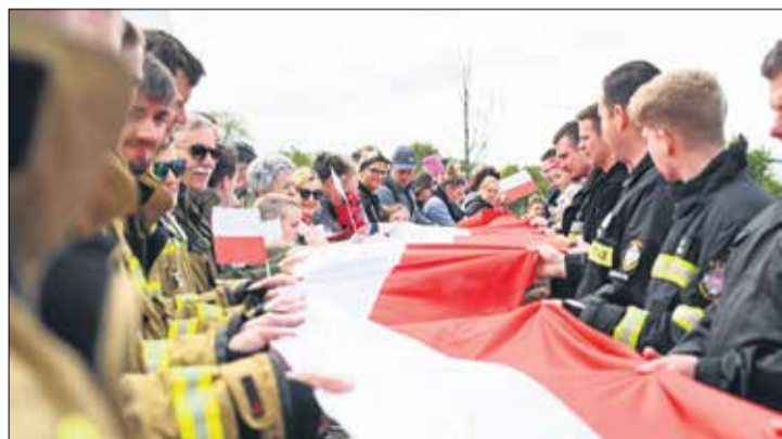
Z okazji Święta Flagi, podczas pikniku w Parku 700-lecia w Tarnowie Podgórny zapraszamy do wspólnego zdjęcia z biało-czerwoną flagą!

Wszystkie wydarzenia, zaplanowane w ramach obchodów 20-lecia obecności Polski w Unii Europejskiej, znajdują się na gminnej stronie internetowej www.tarnowo-podgorne.pl . ARz