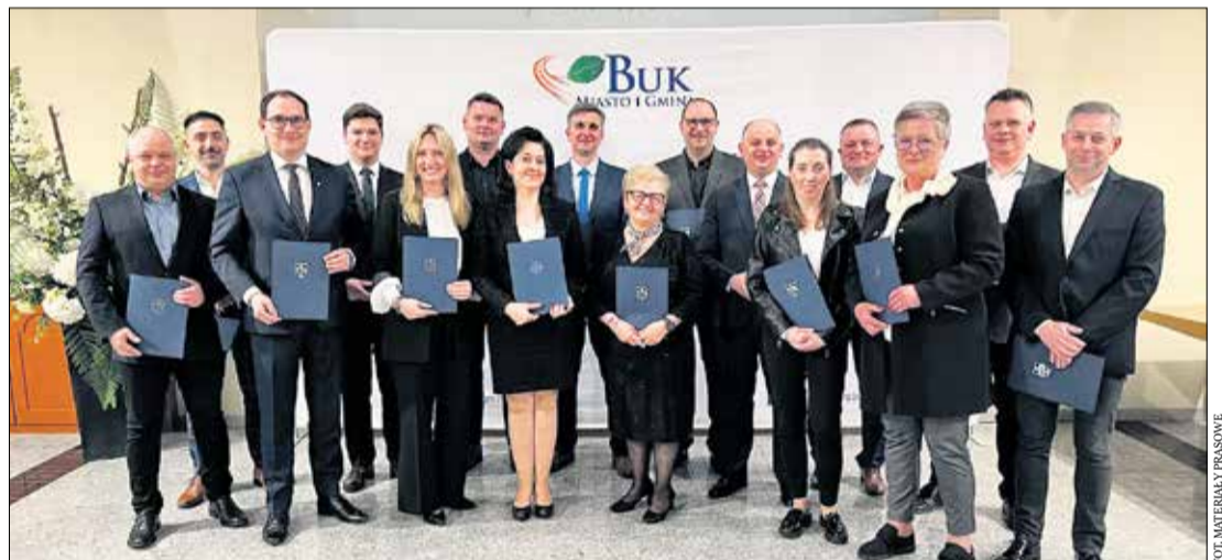
Wręczenie zaświadczeń o wyborze na burmistrza i radnych w kadencji 2024 roku odbyło się 19 kwietnia w Sali Miejskiej w Buku.

O gminie Buk czytaj także na naszglaslopoznanski.pl