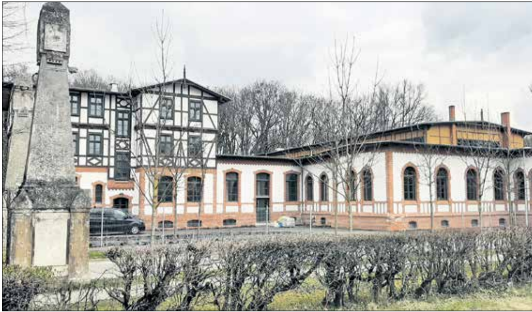
Biedrusko, dawne kasyno wojskowe.

Popularność programu widać w stale rosnącej liczbie wniosków składanych przez mieszkańców i przedsiębiorców z podpoznańskich gmin. W tym roku było ich prawie 50. Atrakcyjności dodaje mu nie tylko ukierunkowanie powiatu