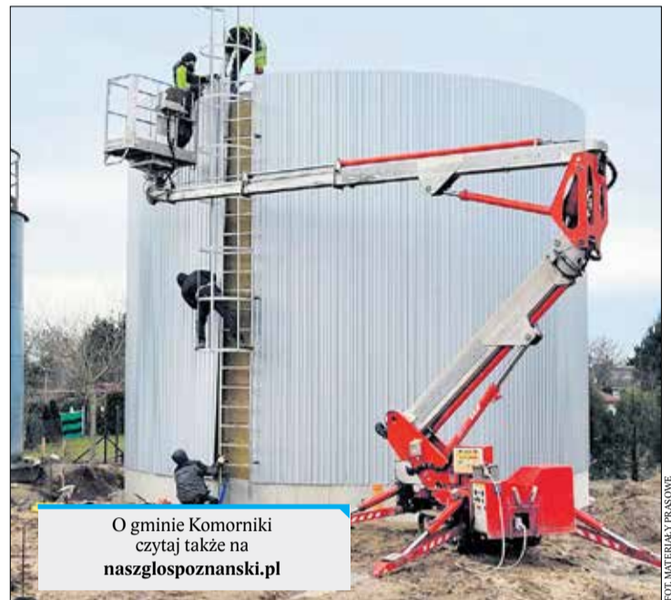
O gminie Komorniki czytaj także na naszglaspozanski.pl

Planowany termin zakończenia inwestycji: kwiecień. PUK się nie zatrzymuje. Systematycznie inwestuje w dobrą jakość wody i utrzymywanie stałych jej dostaw. NK