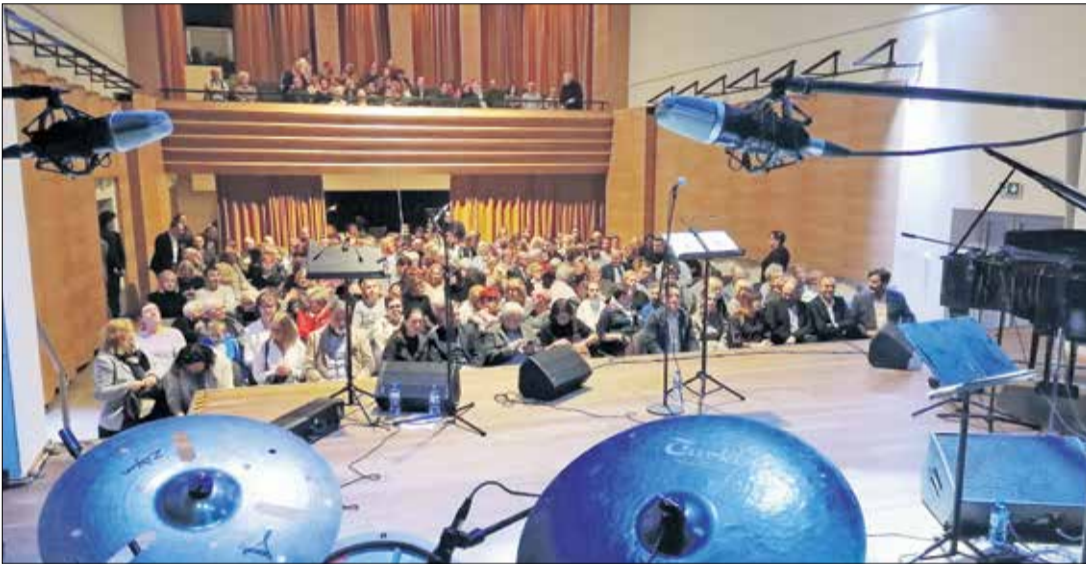
Sala widowiskowa Pobiedziskiego Ośrodka Kultury, w której odbędzie się finał konkursu.

Baw się i zdobywaj nagrody w konkursie Grywalizacja „Zielono-niebieskie Pobiedziska”. Do zabawy możesz przystąpić już dzisiaj. 32 nagrody czekają!