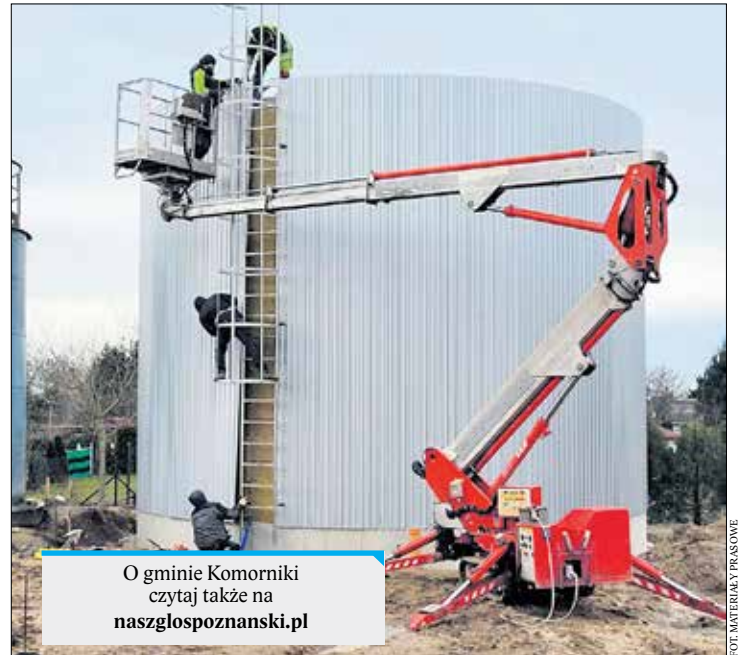
O gminie Komorniki czytaj także na naszglaspozanski.pl

Planowany termin zakończenia inwestycji: kwiecień. PUK się nie zatrzymuje. Systematycznie inwestuje w dobrą jakość wody i utrzymywanie stałych jej dostaw. NK