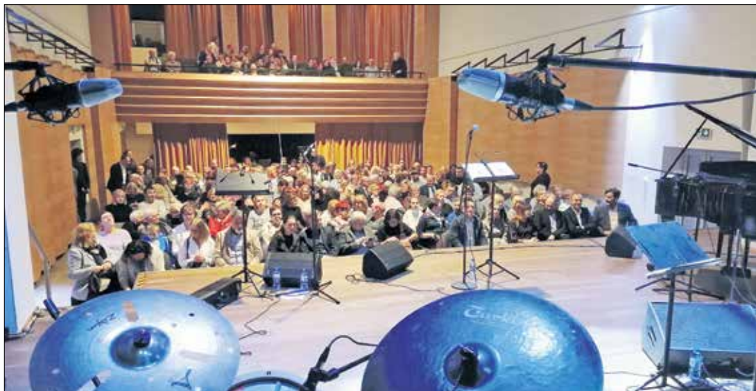
Sala widowiskowa Pobiedziskiego Ośrodka Kultury, w której odbędzie się finał konkursu.

Baw się i zdobywaj nagrody w konkursie Grywalizacja „Zielono-niebieskie Pobiedziska”. Do zabawy możesz przystąpić już dzisiaj. 32 nagrody czekają!