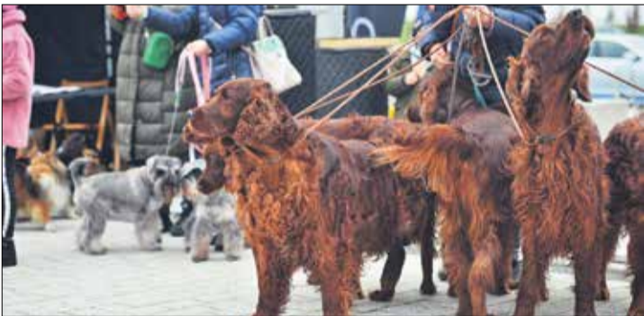
Dzięki poznańskiemu oddziałowi Związku Kynologicznego kwestowały również czworonogi.