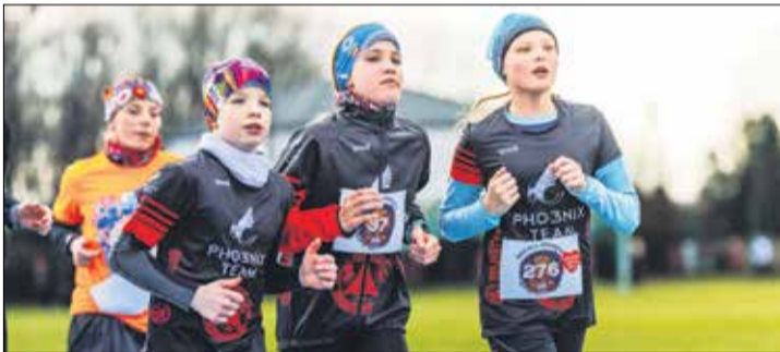
Tradycyjnie na Biegu dla Orkiestry kręcą kolejne charytatywne kilometry.