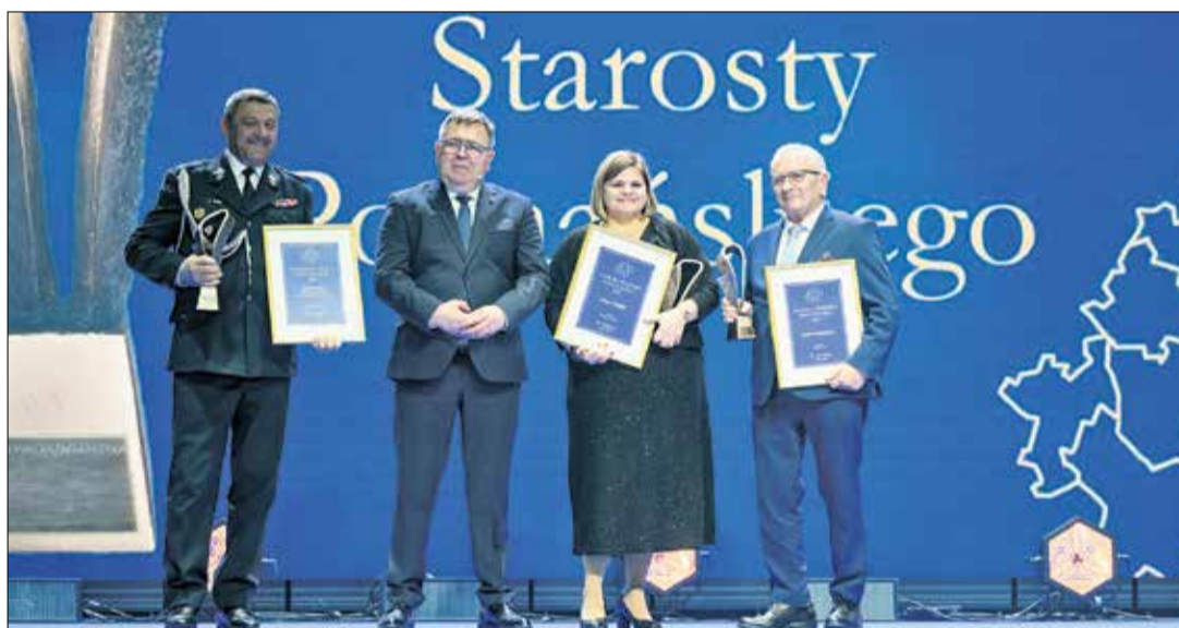
Laureaci Nagrody Starosty Poznańskiego za 2023 r.