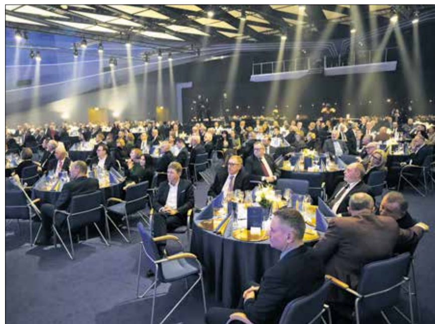
Goście zgromadzeni w Sali Ziemi MTP.