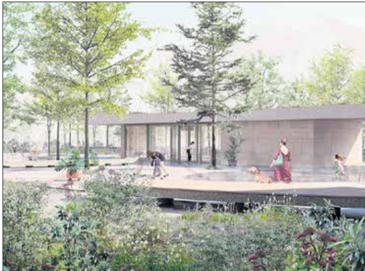
Konkursowa wizualizacja dziedzińca przed CK Zamek.

tach przygotowaliśmy rozpoczynamy tę ważną dla instytucji oraz naszych odbiorców i odbiorczyń inwestycję. Taki czas jest potrzebny na realizację projektu, który zakłada przeobrażenie przestrzeni przed