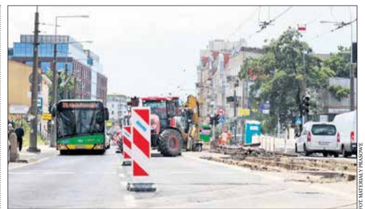
W związku z kolejnym etapem przebudowy torowiska na ul. Głogowskiej zmieni się organizacja ruchu i trasa linii zastępczej T5.

Objazd dla kierowców jadących z Górczyna w stronę centrum wytyczono ulicami Ściegiennego, Arciszewskiego, Reymonta i Grunwaldzką. Natomiast kierowcy jadący w stronę Górczyna z uwagi na