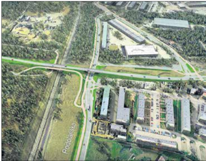
Ogłoszono przetarg na budowę wiaduktu wraz z kładką pieszo-rowerową w ciągu ul. Lutyckiej.

- Wyloniony w postępowaniu przetargowym wykonawca zajmie się budową wiaduktu i tym samym likwidacją przejazdu kolejowego w ciągu ul. Lutyckiej. Nad torowiskiem powstanie także kładka pieszo-rowerowa, która zapewni bezpieczny i wygodny dostęp do zielonych terenów rekreacyjnych w re-