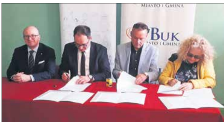
Umowę podpisano 11 maja.

– Pomieszczenie zastępcze, które obecnie spełnia rolę sali gimnastycznej, nie odpowiada wymogom.