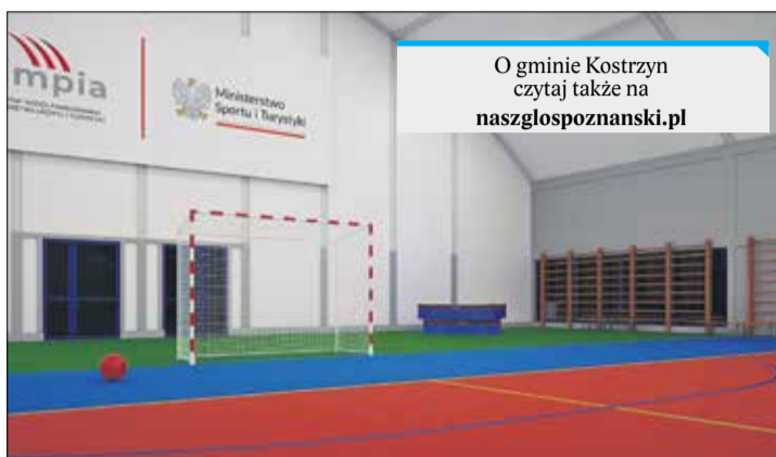
O gminie Kostrzyn czytaj także na naszglospoznanski.pl

Zadaszenie boiska (zamknięta stelażowa konstrukcja dachu i ścian) było od wielu lat zadaniem priorytetowym dla funkcjonowania Szkoły Podstawowej w Brzeźnie.