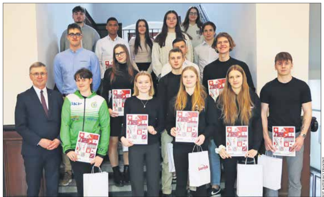
FOT. MATERIAŁ PRASOWY

stypendia na rok 2023, za wyniki sportowe osiągnięte w roku poprzednim. Z budżetu Swarzędza przeznaczono na ten cel 69 tys. zł