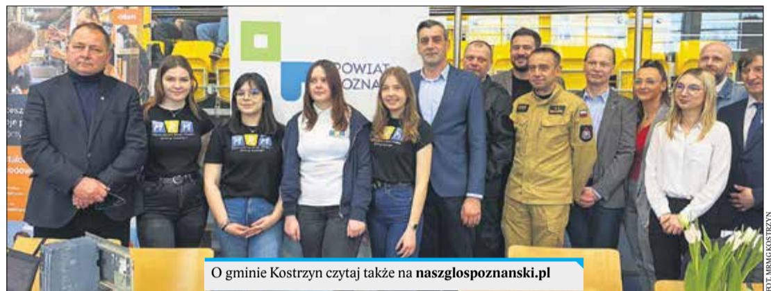
O gminie Kostrzyn czytaj także na naszglaspozanski.pl

3 marca w hali sportowej przy Szkole Podstawowej nr 1 im. Ewarysta Estkowskiego odbyły się VII Targi Edukacyjne i Zawodów organizowane przez Młodzieżową Radę Miejską Gminy Kostrzyn