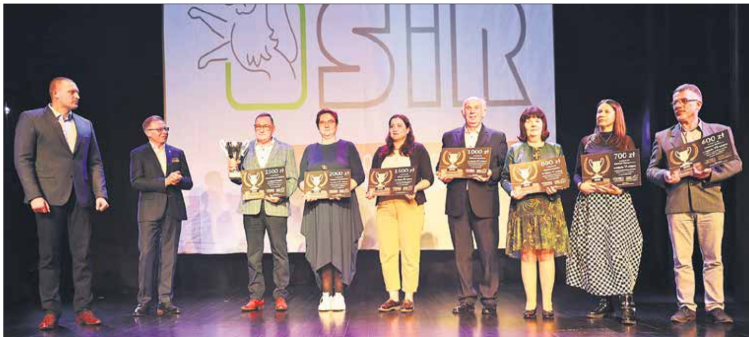
Podczas II Gali Sportu Gminy Tarnowo Podgórne wręczono okolicznościowe czeki dla siedmiu najlepszych sołectw.