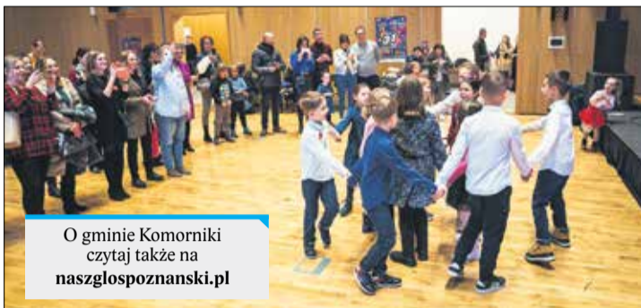
O gminie Komorniki czytaj także na naszglaspoznancki.pl