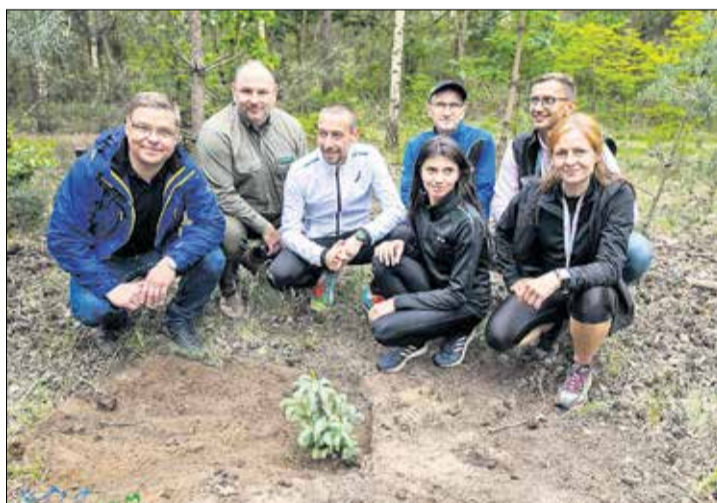
Zwycięzcy posadzili wspólnie drzewko.

Historyczny sukces odnotowała w tym roku drużyna samorządowa „Urząd Biega”. W biegu zajęła ona drugie miejsce, a w chodzie - miejsce trzecie. Ustanowiła ona również swój rekord liczebności. Zielone