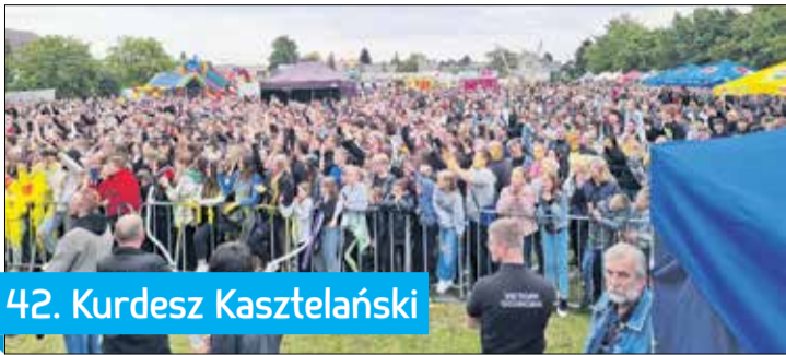
42. Kurdesz Kasztelański

28 maja na scenie gościła Średzka Orkiestra Dęta, Zespół Wokalny Akord, Zespół Pieśni i Tańca Siekieracy, a także MIG, Czerwone Gitary oraz Happysad. Całość zwińczyła wspólna zabawa. 29 maja z okazji nadchodzącego Dnia Dziecka na