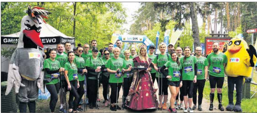
Drużyna samorządowa „Urząd Biega”.

NASZ PATRONAT Podczas 11 edycji „Biegu o Koronę Księżnej Dąbrówki” padł rekord leśnej 10-kilometrowej trasy