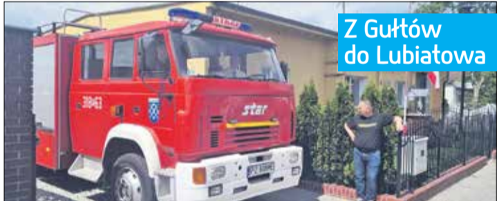
Z Gułtów do Lubiatowa

ma jest m.in. operatorem w nowym publicznym przedszkolu „Bajkowa Kraina” w Kostrzynie. Nowe przedszkole zgodnie z założeniami ma rozpocząć działalność 1 września 2023 r. SM