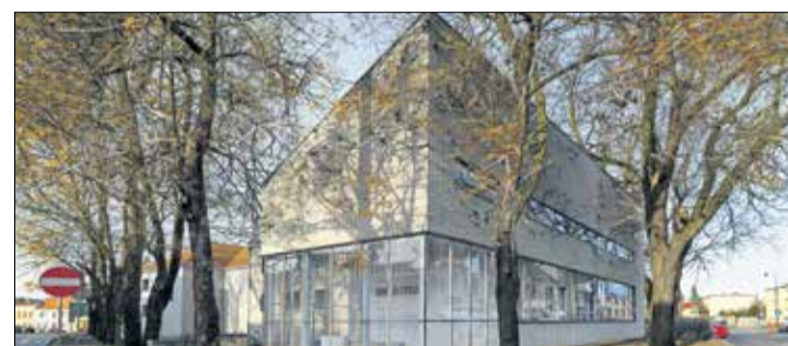
Projekt i wizualizacja Neostudio Architektury Świerkowski Jarosz Sp. P.

wpasowana we wschodnią część placu, otwarta na zewnątrz i dająca odpowiednio dla instytucji światło i przestrzeń, podkreśli znaczenie tego miejsca na kulturalnej mapie miasta. Wraz z planowaną termomodernizacją już istniejącego budynku biblioteki i kina stanowić będzie spójną całość.