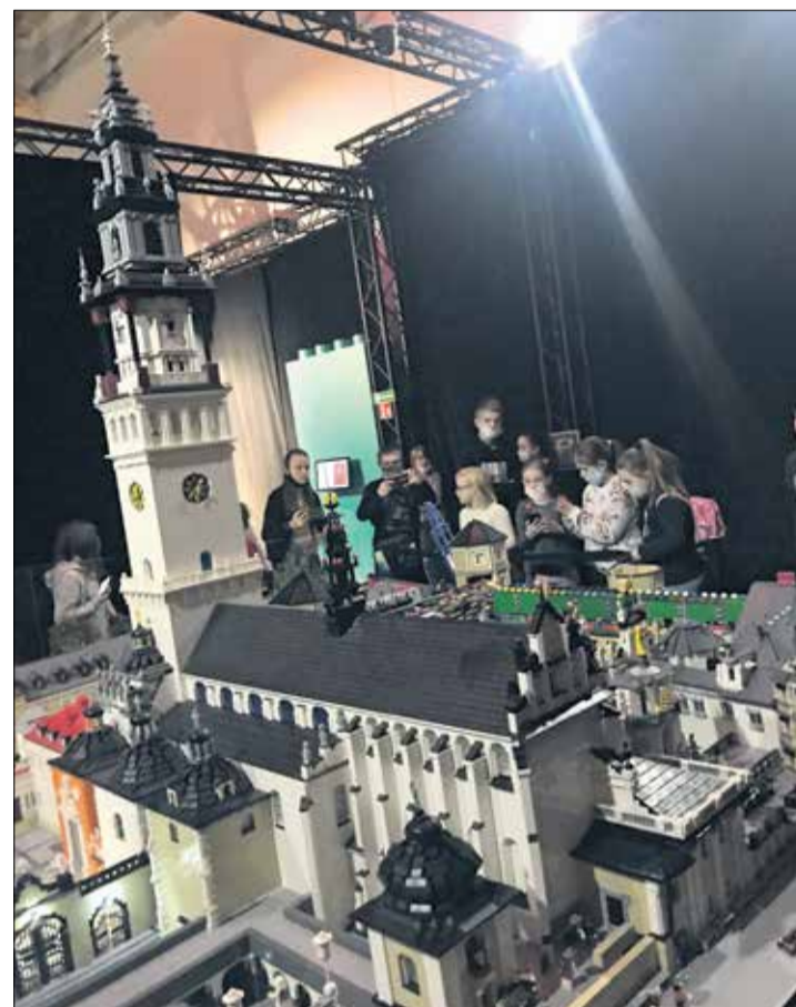
Klocki LEGO, które pokazują historię Polski, czyli Salon Klocków Lego w Poznaniu.

Dla większości uczestników zajęcia te były doskonałą okazją do wyjścia z domu, spotkania z przyjaciółmi, czy możliwością nauzenia się czegoś nowego