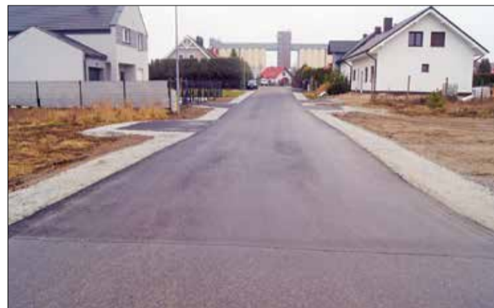
Ul. Różana w Robakowie.