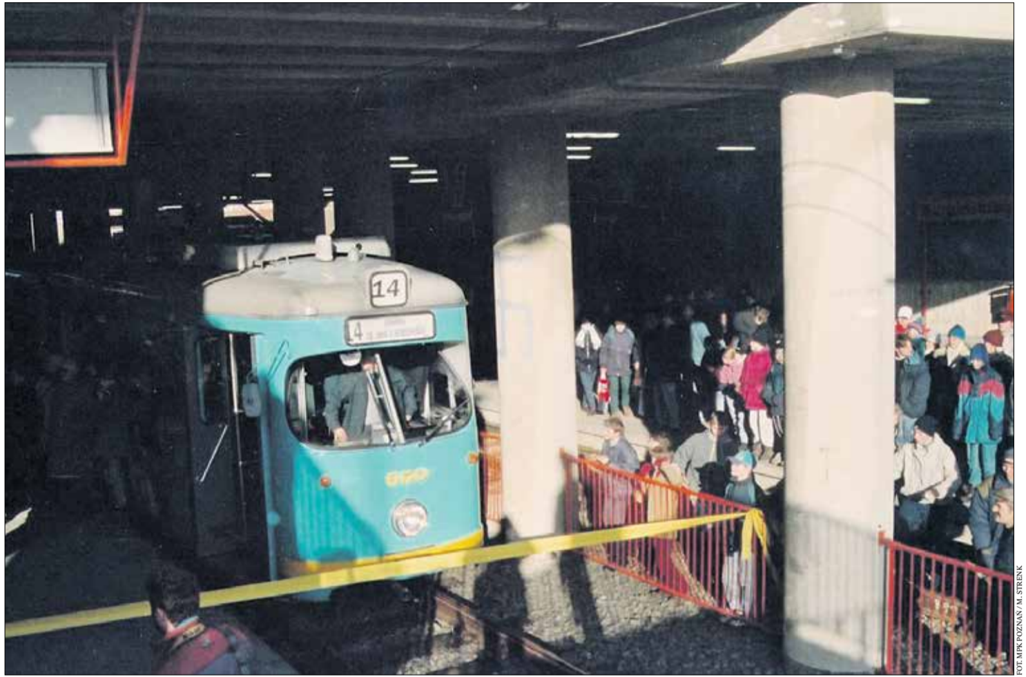
Oficjalna inauguracja i przecięcie wstęgi odbyła się na przystanku Kurpińskiego.

Prace nad budową pierwszego odcinka PST (od os. Sobieskiego do ul. Roosevelta) rozpoczęły się w 1980 roku i trwały aż 17 lat. Ich zakres był ogromny. Na ponad 6-kilometrowej trasie powstało: 6 wiaduktów drogowych, 2 tramwajowe, 1 kolejowy, estakada długości 700 metrów, 3 kładki technologiczne i 3 przeznaczone dla pieszych, 10 przystanków przesiadkowych