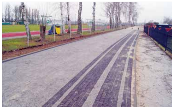
Ul. Błonie w Kórniku.