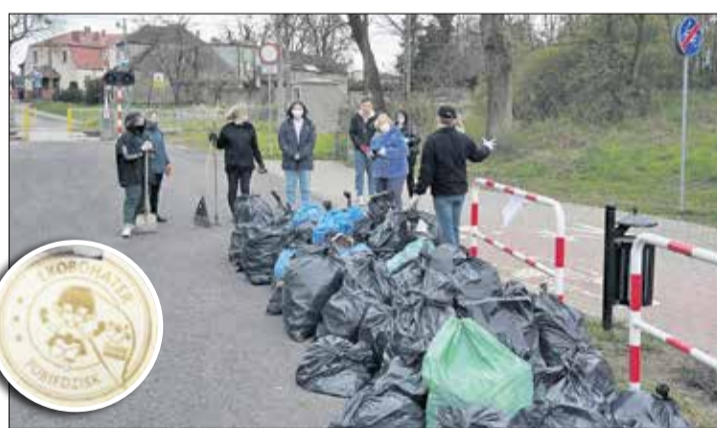
Zebrano kilkaset worków śmieci.

proekologiczny w obronie lasów i zwierząt. Chcieliśmy przynajmniej spróbować dotrzeć do wyobraźni tych osób, które porzucają śmieci w lasach. Podczas kilku spotkań w gronie zapaleńców, poszerzonej o specjalistów – leśnika, fachowca od reklamy, operatora filmowego narodził się scenariusz i powstał spot „Jak Zosia została Ekobohaterem Pobiedzisk” – opowiadają twórcy.