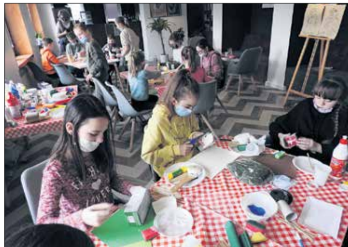
Świat hobbitów na wyciągnięcie ręki – warsztaty „Przygoda w Śródziemiu” w „Stopklatce”.