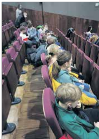
Trudno ukryć emocje, kiedy psiami rządzi – „Corgi: Psiak Królowej” w kinie „Wielkopolanin”.