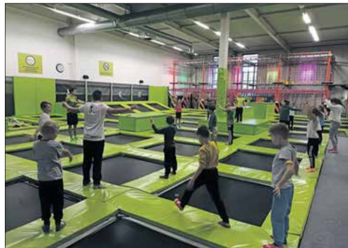
W Parku Trampolin Jump Arena w Poznaniu saltom, fikołkom, skokom nie było końca.