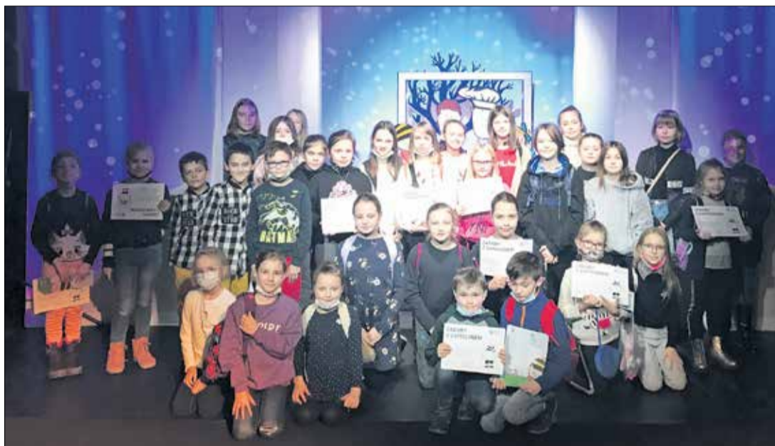
W Teatrze Animacji w Poznaniu była okazja, aby stanąć po drugiej stronie sceny.

Pomimo ograniczeń związanych z pandemią, w trakcie ferii zimowych, dzieci i młodzież mogły skorzystać z oferty gminnych placówek w Buku