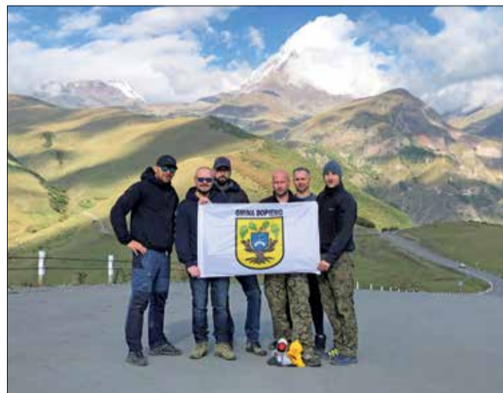
Uczestnicy wyprawy z flagą gminy Dopiewo i jej maskotkami – żurawiem DOP i wilgą EWO. W tle pięciotysięcznik Kazbek.

wozami terenowymi pokonali w 2 tygodnie 9 tysięcy kilometrów. Dotarli w miejsca dzikie, dalekie od cywilizacji. Nocowali na łonie natury w namiotach rozbitych na dachach samochodów. Zanim obrali kierunek Gruzja, zdobywali doświadczenia w kraju, w Albanii, na Ukrainie i w Rumunii. AM