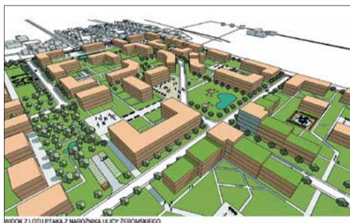
WIDOK Z LOTU PTAKA Z NAROŻNIKA ULICY ŻEROMSKIEGO

Dla ww. działki zostały wpłacone cztery wadła, do przetargu zostało dopuszczonych czterech uczestników spełniających warunki przetargu. Cena wywoławcza wynosiła 13 750.000,00 zł netto + 23% podatek VAT. Cena uzyskana w przetargu po 64 postąpieniach wyniosła 22 575 000,00 zł netto + 23% podatek VAT. Nabywcą wyłonionym w przetargu została firma: Jakon Inwest 3 Sp. z o.o., z siedzibą przy ul. Sowiej 4 w Tarnowie Podgórnym. AD