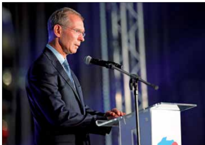
Senator Zygmunt Frankiewicz, prezes Związku Miast Polskich.

Codziennie potrzeby mieszkańców zaspokaja samorząd, który odpowiada za to, aby z kranu płynęła woda, aby śmieci były na czas odebrane, aby zapewnić transport publiczny, aby dzieci chodziły do szkoły itd. A żeby wszystkie te zadania mogły być realizowane, potrzebne są stabilne finanse. Podział publicznych pieniędzy powinien opierać się na uzgodnionych zasadach, a nie na widzimisię tego czy innego przedstawiciela rządu. Reforma finansów powinna objąć wprowadzenie zasady rocznej waloryzacji dochodów budżetów samorządowych z podatku PIT – o wskaźnik wzrostu płac. Po drugie: 100 % pokrycia kosztów