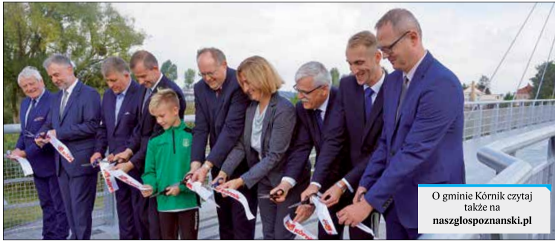
O gminie Kórnik czytaj także na naszglaspozanski.pl

Kładka nad Jeziorem Kórnickim jest zwieńczeniem promenady im. Wisławy Szymborskiej, a zarazem połączeniem pomiędzy terenami miasta, jego zabytkami, a centrum