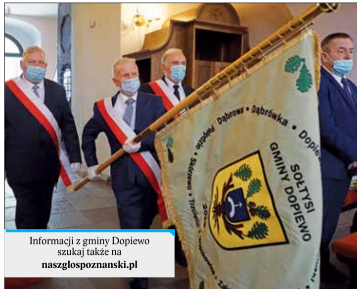
Informacji z gminy Dopiewo szukaj także na naszglaspoznanski.pl

Wizerunek Matki Boskiej Zielnej zdobi Sztandar Sołtysów Gminy Dopiewo