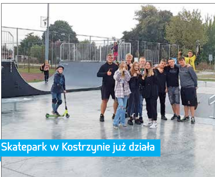
Skatepark w Kostrzynie już działa

Termin realizacji zadania przez powiat poznański to sierpień 2022 roku. UM