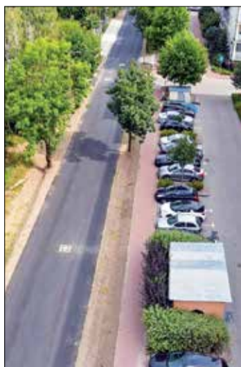
Ul. Mateckiego na Piątkowie zyskała m.in. wygodny chodnik.

- To kolejne przedsięwzięcia, które realizujemy na peryferyjnych osiedlach. Mimo że nie mają one takiego rozmachu jak np. rewitalizacja Centrum czy budowa trasy tramwajowej na Naramowice, to ich znaczenie dla mieszkańców jest równie istotne. Prace na ul. Mateckiego umożliwią następne inwestycje mieszkaniowe w tym obszarze, zaś nowy chodnik i oświetlenie przy ul. Morasko poprawią bezpieczeń-