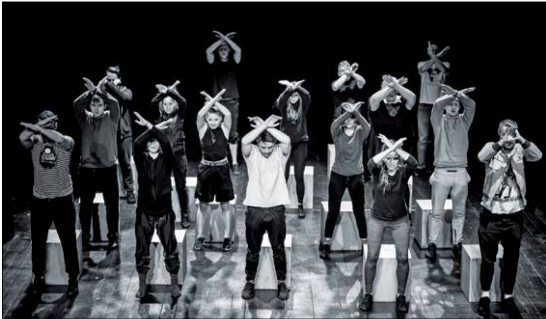
Zdjęcie z próby do spektaklu „Kombinat”.

Możesz tę przestrogę zignorować. Nic się wtedy nie zmieni. Posady znanego Ci świata ani drgną. Będziesz nadal istniał. Krok za krokiem, dzień za dniem. Ty, a nad Tobą oni. Cicho, spokojnie, bezpiecznie. Znasz ten stan ducha, umysłu, ciała. Niby Twój, ale jakby... poza Tobą? Cisza dziwnie wygłusza, spokój obezwładnia, a bezpieczeństwo pozbawia sprawczości. Przyparty do muru uznasz, że gdzieś w głębi, zawsze wydawało