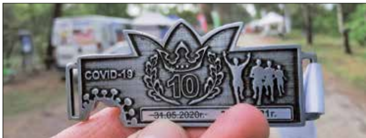
Medal jubileuszowej „Korony Dąbrówki” upamiętnia przesunięcie zawodów o rok. Na jego rewersie znajduje się rysunek przedstawiający koronawirusa i napis „COVID-19”, a także daty startów: przekreślona tego, który nie doszedł do skutku - „31.05.2020 r.” i tegoroczną - „30.05.2021 r.”