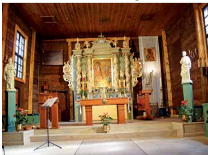
Kościół św. Marii Magdaleny w Długiej Goślinie.

– Należy wspomnieć o nowości w powiatowych dotacjach, jaką jest konserwacja zieleni. Mowa o pracach w koronach wiekowych drzew pomnikowych z alei lipowych