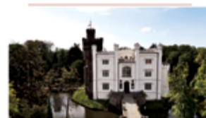
Zamek w Kórniku Wspieramy renowację zabytków Łączna kwota dotacji Miasta i Gminy Kórnik w 2020 roku: 150.000,00 zł

Płacąc podatek dochodowy w Gminie Kórnik, sprawiasz, że Gmina będzie miała więcej środków na budowę dróg, chodników, infrastruktury technicznej, ścieżek rowerowych, szkół, placów zabaw.