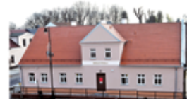
Biblioteka Publiczna w Kórniku Filia w Bninie Łączna kwota inwestycji: 3.883.558,08 zł