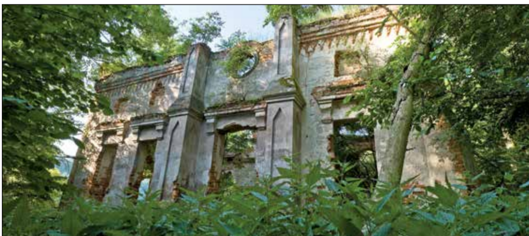
Romantyczny zameczek na wyspie Jeziora Góreckiego.