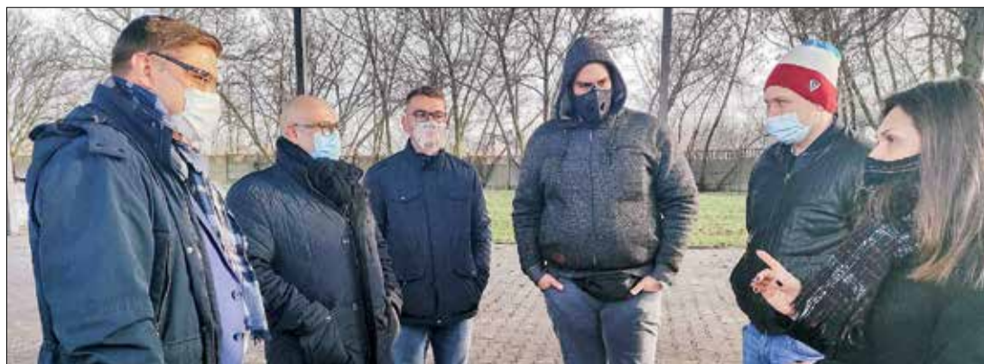
Wizja lokalna miejsca pod punkt szczepień w Dopiewie.