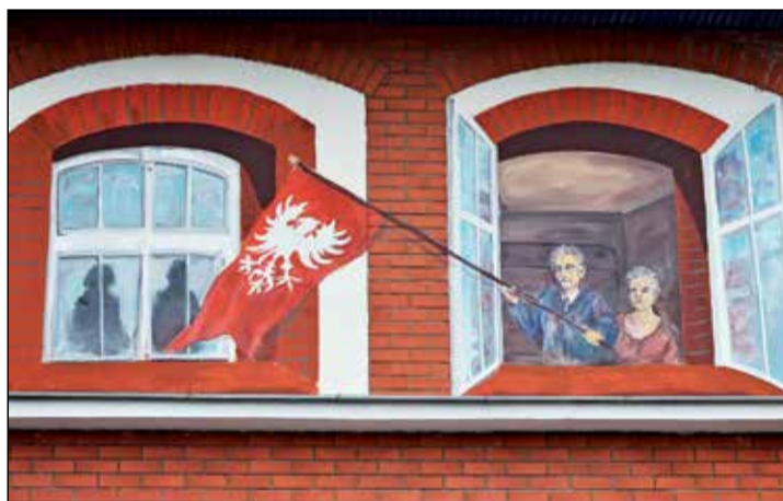
Fragment muralu powstańczego w Buku.