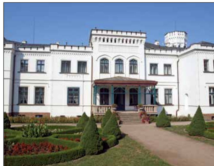
Pałac w Będlewie.