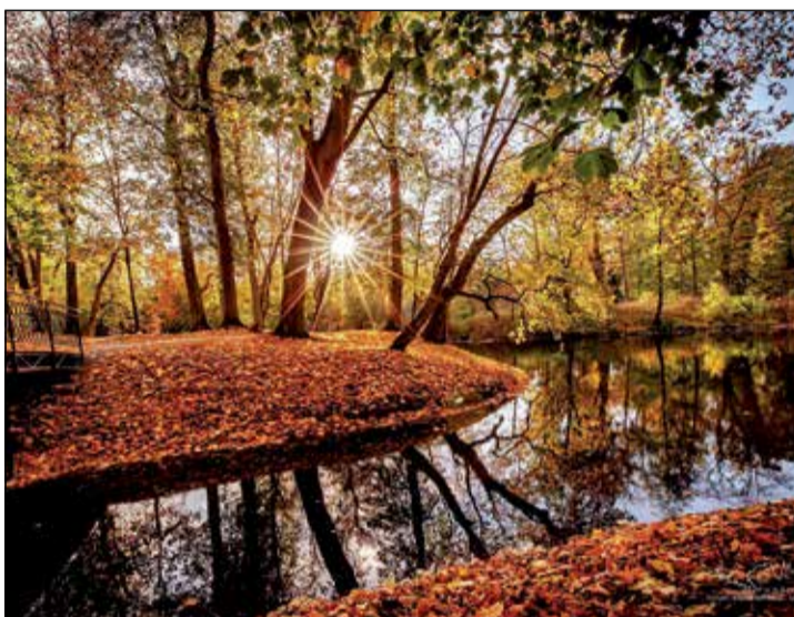
Wyspa Miłości w Jankowicach.