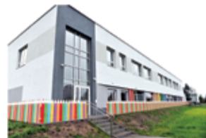
Skola Podstawowa w Radzewie Termomodernizacja i rozbudowa Łączna kwota inwestycji: 9.199.523,56 zł

Kto może płacić podatek w Gminie Kórnik?