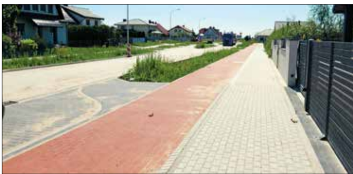
Postępują prace przy remoncie ul. Wyszyńskiego i ul. Liliowej w Kostrzynie. Zakończenie inwestycji planowane jest na listopad 2020 r. Red