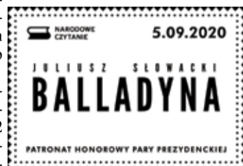
PATRONAT HONOROWY PARY PREZYDENCKIEJ

gotowanego na tę okazję zbioru „Antologia Niepodległości”. Rok temu czytaliśmy nowele polskich autorów, m.in. Elizy Orzeszkowej, Marii Konopnickiej i Henryka Rzewuskiego.