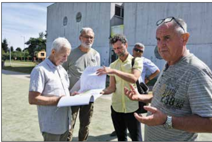
Przedstawiciele wykonawcy przejęli plac budowy.