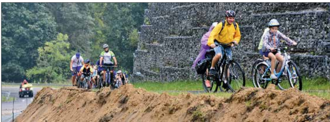
Podjazd do Kociałkowej Górki nie jest łatwy, za to satysfakcja z pokonania tego odcinka jest ogromna.