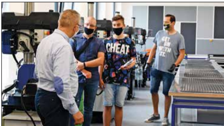
Drzwi Otwarte w Zespole Szkół Technicznych były okazją do poznania oferty placówki. Na pytania odpowiadali nauczyciele i przedstawiciele firm partnerskich.

skorzystać. Widząc jak duże jest zainteresowanie ofertą edukacyjną, zaplanowano drugą edycję Drzwi Otwartych – 4 lipca. Zapisy są prowadzone poprzez stronę facebookową Zespołu Szkół Technicznych (liczba miejsc, ze względu na pandemię, ograniczona).