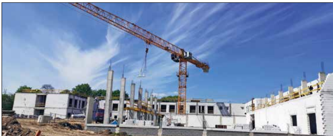
Nowa Szkoła Podstawowa powstaje w Wirach.

Mimo wakacji, a także stanu pandemii, w gminie Komorniki nie zwalniają z inwestycjami