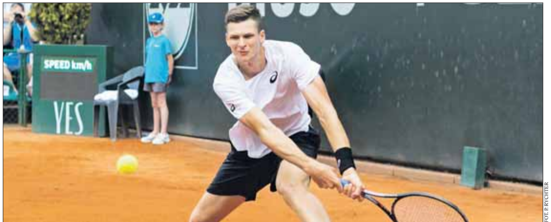
Hubert Hurkacz przed rokiem triumfował w Poznaniu.