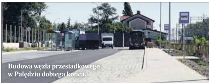
Budowa węzła przesiadkowego w Pałędziu dobiega końca.

Inwestycje w otoczenie stacji kolejowych w Pałędziu i Dopiewie polegają m.in. na stworzeniu parkingów, wiat rowerowych, info-kiosków, systemu monitoringu, tablic informacyjnych, ławek, udogodnień dla niepełnosprawnych i mieszkań-