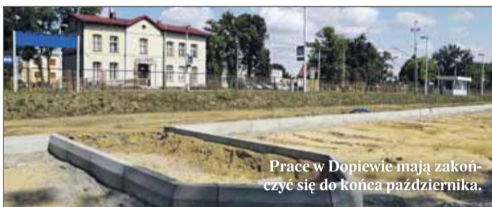
Prace w Dopiewie mają zakończyć się do końca października.