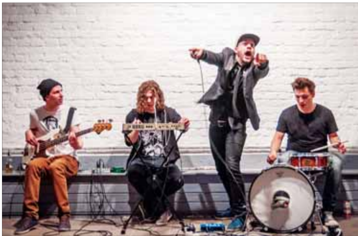
Gwiazda wieczoru, grupa Mörk, przyjedzie do Lusowa z Budapesztu.