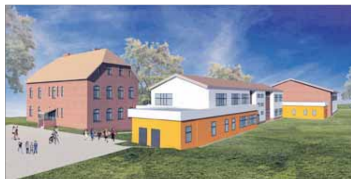
Tak ma wyglądać nowe skrzydło szkoły.