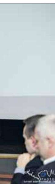
...e małe ojczyzny –

...ska. A uczestnicy spotkania przyjęli je z pełnym zrozumieniem. Każdy bowiem wójt, burmistrz czy ... połowę wyborców