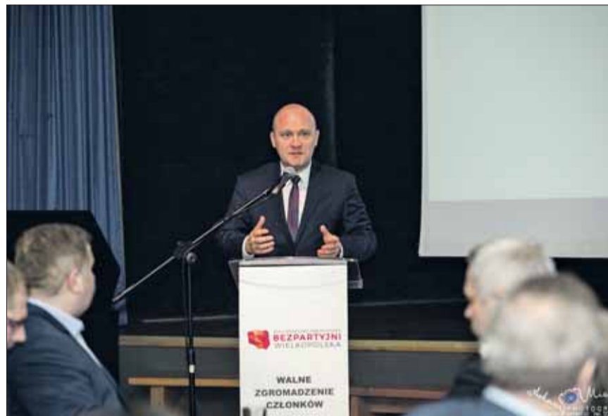
Piotr Krzystek, Prezydent Szczecina: – Bezpartyjni są antidotum na partyjne spory i przepychanki.