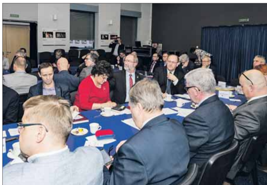
Uczestnicy Walnego Zebrania w Tarnowie Podgórnym.