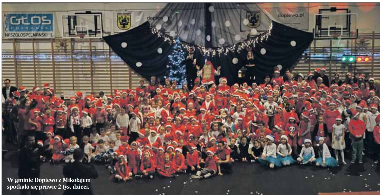
W gminie Dopiewo z Mikołajem spotkało się prawie 2 tys. dzieci.

Nie tylko najmłodsi byli pod wrażeniem prawdziwego Mikołaja z dalekiej Laponii... nawet dorośli ponownie uwierzyli, że istnieje naprawdę... Red