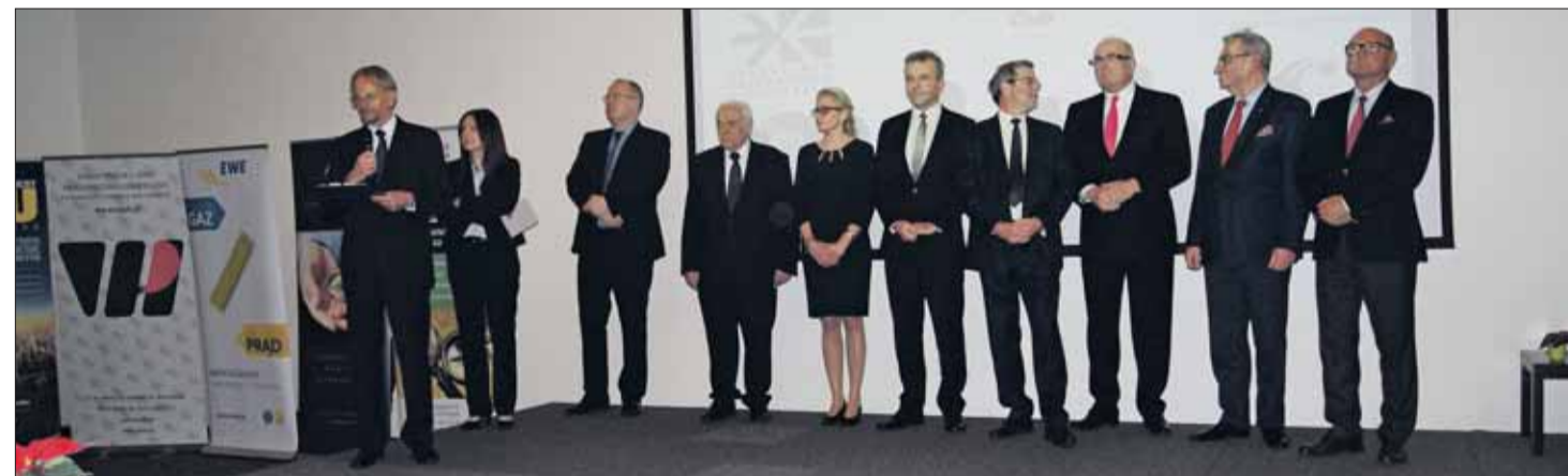
Krótkie przemówienie wygłosili szefowie dziewięciu wielkopolskich organizacji biznesowych.

W przedświątecznej atmosferze, w hotelu IBB Andersia w Poznaniu, spotkali się członkowie dziewięciu czołowych organizacji gospodarczych działających w naszym regionie: Wielkopolskiego Klubu Kapitału, Wielkopolskiej Loży BCC, Polskiej Izby Gospodarczej Importerów, Eksporterów i Kooperacji, Wielkopolskiego Związku Pracodawców Lewiatan, Wielkopolskiej Izby Przemysłowo-Handlowej, Pracodawców RP – Wielkopolska, Wielkopolskiej Izby Rzemieśniczej w Poznaniu, Polsko-Niemieckiego Koła Gospodarczego DWK oraz Polsko-Niemieckiej Izby Przemysłowo-Handlowej (AHK Polska) spotkali się, aby wspólnie złożyć sobie życzenia na nadchodzący świą-