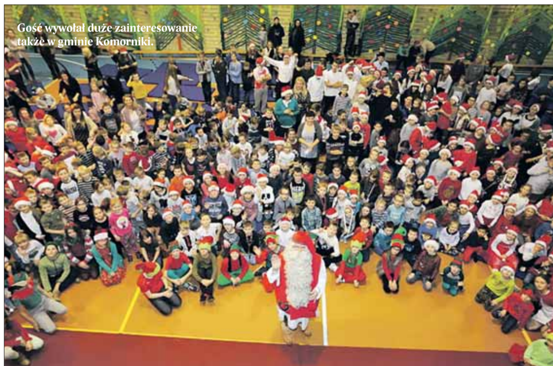
Gość wywołał duże zainteresowanie także w gminie Komorniki.