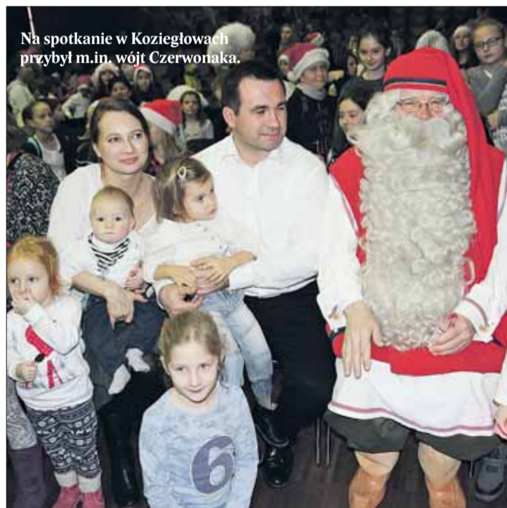
Na spotkanie w Koziegłowach przybył m.in. wójt Czerwonaka.