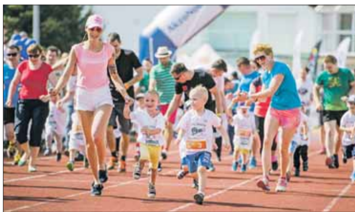
Od godziny 10 będą trwać zawody dla dzieci i młodzieży.