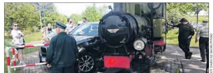
– Nie możemy w to uwierzyć. Pierwszy weekend „Borsuka” po generalnej naprawie... – skomentowało na facebooku MPK. Red

Według nadzoru ruchu MPK, winny wypadku był kierowca samochodu, który zlekceważył ustawione przed każdym przejazdem znaki ostrzegawcze.