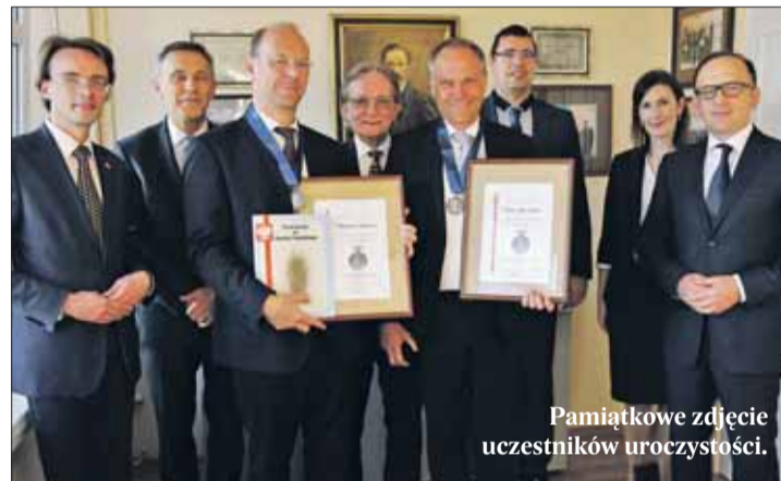
Pamiętkowe zdjęcie uczestników uroczystości.