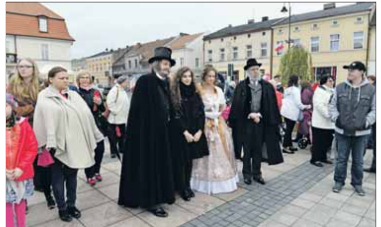
Na rynku pojawili się m.in. hrabia Zamoyski, hrabia Działyński oraz generałowa Zamoyska i hrabina Celestyna.