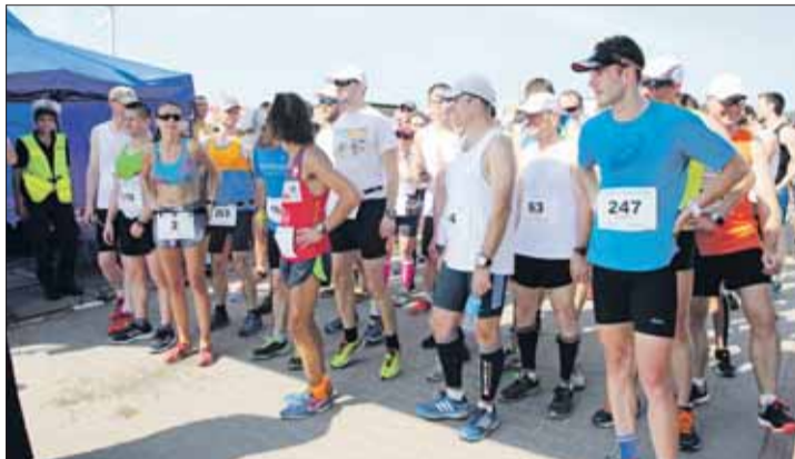
W ub. roku wystartowało ok. 300 biegaczy.

cyku oraz plac zabaw do pełnej dyspozycji. Przewidzieliśmy też stoiska oferujące różne przekąski. Imprezie uświetni również występ dj'a oraz pokaz strażacki – komentuje Tomasz Ostajewski z Novum Plus.