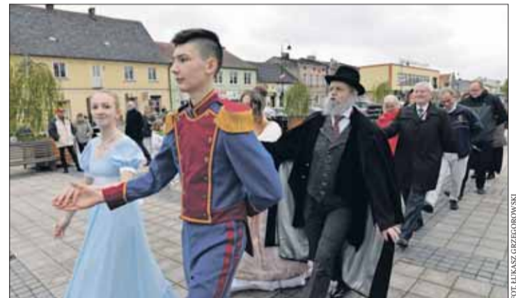
Do poloneza włączyli się widzowie i goście.

na zapomnieć o strażakach, którzy odkurzyli swoją zabytkową pompę na konnym wozie i przeprowadzili pokaz. Ich wkład jest tym bardziej warty docenienia, gdy dowiemy się, że w sobotę i niedzielę brali udział w akcjach ratunkowych, w tym gąsili płonący samochód podczas tragicznego wypadku na obwodnicy miasta.