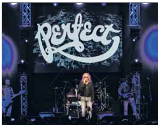
Na zakończenie zagrał zespół Perfect.

W kategorii „Społecznik” uhonorowano Stowarzyszenie Emerytów i Rencistów „Pod Kasztanem”, które gromadzi osoby z całej gminy, a jest ich prawie 60. Celem stowarzyszenia jest zaspokajanie potrzeb członków w obszarze kulturalno-oświatowym i rekreacyjnym, łącząc rozrywkę z odpoczynkiem. Seniorzy wspólnie obchodzą święta oraz inne uroczystości. Jeżdżą na wycieczki, organizują pikniki, na których spotykają się całymi rodzinami. Uczestniczą w imprezach na terenie gminy Rokietnica. W stowarzyszeniu działa zespół wokalny, który spotyka się na cotygodniowych próbach. Śpiewacy z sukcesami uczestniczą w przeglądach i festiwalach.