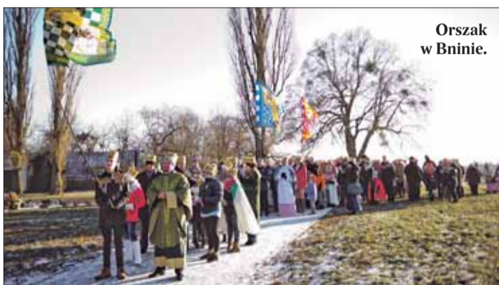
Orszak w Bninie.