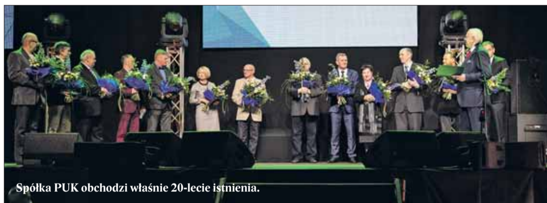
Spółka PUK obchodzi właśnie 20-lecie istnienia.