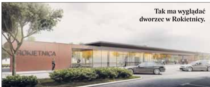
Tak ma wyglądać dworzec w Rokietnicy.

ostatnio prosperuje, jest obiektem ważnym dla działających w gminie okolicach przedsiębiorców. Nie musi jednak znajdować się w sercu gminy. Już dziś mieszkańcy skarżą się na hałas i na dojeżdżające tu ciężarówki. To co zaplanowano zaś na przyszłość to jeszcze większa prowizorka – punkt przeładunkowy według planów PKP miałby bowiem obsługiwać zaledwie kilka wagonów. Do tego bezpośrednio graniczyłyby z peronami pasażerskimi. O spełnionych normach bezpieczeństwa należy więc zapomnieć. Gmina Rokietnica wskazała alternatywne lokalizacje punktu ładunkowego z prawdziwego zdarze-