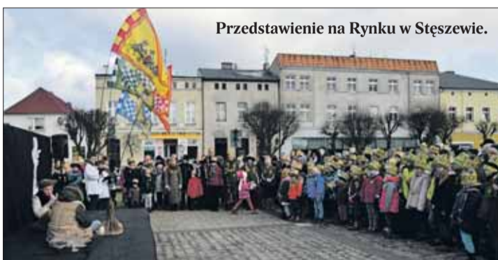
Przedstawienie na Rynku w Stęszewie.