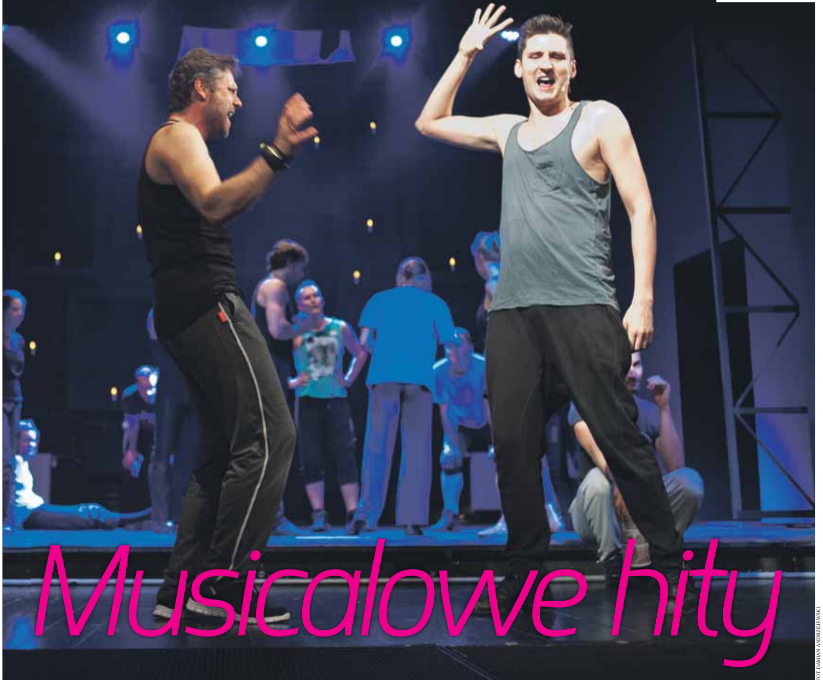
FOT. DAMIAN ANDRZEJEWSKI