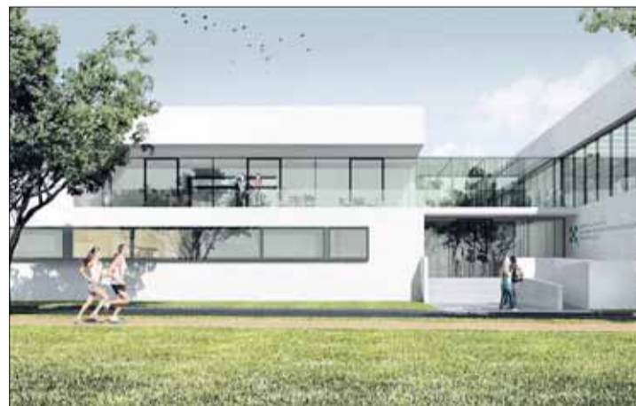
Wizualizacja koncepcji architektoniczno-urbanistycznej Centrum Kształcenia Praktycznego przy Zespole Szkół nr 1 w Swarzędzu.