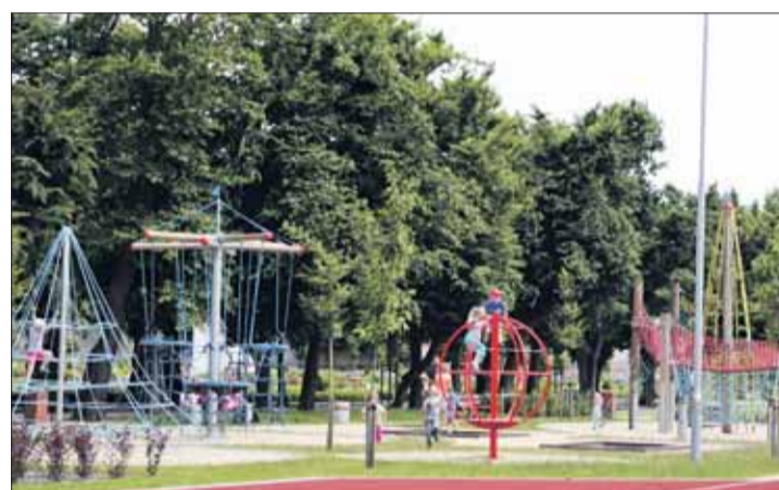
Park Orientacji Przestrzennej w Owińskach.