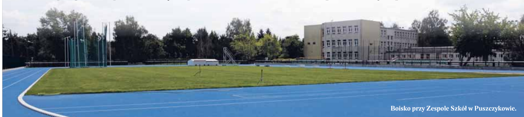
Boisko przy Zespole Szkół w Puszczykowie.

1 września progi szkół prowadzonych przez starostwo w Poznaniu przekroczyło ponad 3.300 uczniów