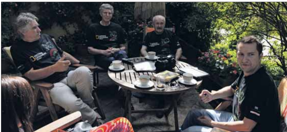
Uczestnicy wyprawy podczas narady w Puszczykowie.

– Rozpoczęcie wyprawy odbędzie się w Puszczykowie, stąd uczestnicy wyruszą na kontynent południowoamerykański do Boliwii i Peru – czytamy na www.ekspedycje.amazonskie.pl . – Czekają nas lądowanie na jednym z najwyższych położonych lot-