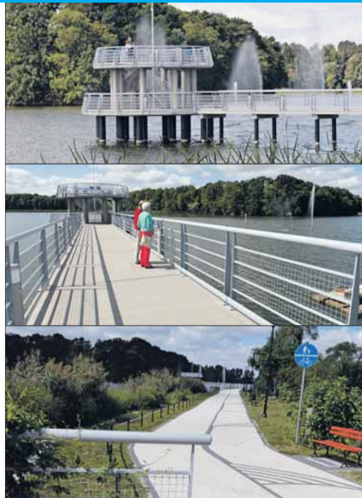
Oddano do użytku nowy odcinek promenady nad Jeziorem Kórnickim. Przy głównym moście tryska już fontanna. Prace trwają jedynie na kładce przy zamku, która będzie ukończona do 30 października.