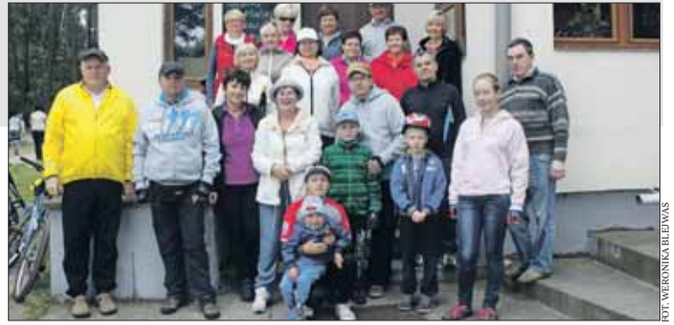
Pamiątkowe zdjęcie uczestników wycieczki.

To wszystko złożyło się na dużą liczbę „pamiątek” z kilku wieków związanych z Turcją. Choć wiele z nich na dzień mogą Państwo oglądać w muzeum, na wystawie czasowej, która potrwa do 23 października, zaprezentowano te, które są jeszcze skrywane w magazynach Muzeum Kórnickiego. Jakie eksponaty można zobaczyć? Czytaj na www.naszglospoznanski.pl . Monika Malecka