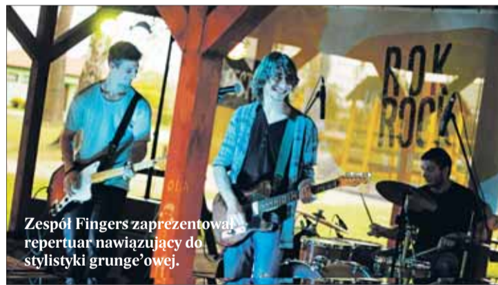
Zespół Fingers zaprezentował repertuar nawiązujący do stylistyki grunge'owej.

Zespół D-Kolt zameldował się na scenie na kilka minut przed godziną 20. Na szczególną uwagę zasługuje obecność w instrumentarium zespołu organów Hammonda, dość rzadko spotykanych wśród młodych zespołów. Na uwagę zasługują rów-