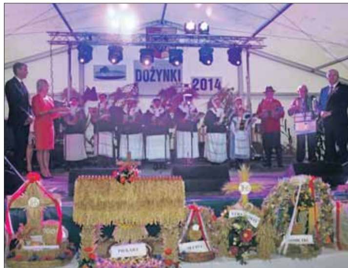
Starostowie przekazali burmistrzowi bochen chleba.

Tegoroczne Święto Plonów gminie Stęszew odbyło się w Sapowicach