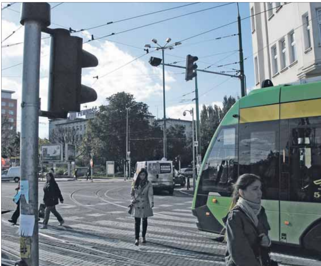
Przez „Teatralkę” wraz z nowym rozkładem jazdy przejeżdża aż 14... 19 linii tramwajowych.

Główne obciążenie komunikacyjne spoczywa więc na „Teatralce”. Wiadukt ten jest jedynym tramwajowym łącznikiem między śródmieściem a północno-zachodnimi i południowo-zachodnimi dzielnicami miasta. Mści się brak połączenia ulicą Towarową (przed przebudową Kaponiery można było zbudować z ulicy Święty Marcin prawy skręt dla tramwajów w ulicę Towarową, jak też wyremontować tam istniejący krótki odcinek torów. Wówczas kilka linii tramwajowych, np. 5, 8 czy 13 mogłoby omijać Most Teatralny.