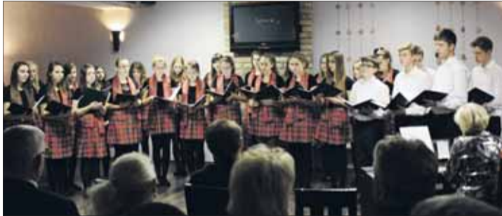
Spotkanie uświetnił chór Allegro.

Na 22 stycznia natomiast zaplanowano bardzo interesujące spotkanie z Maciejem Relugą – głównym ekonomistą BZ WBK. Jest on uważany za jednego z najlepszych ekonomistów i analityków zjawisk makroekonomicznych w Polsce. Spotkanie będzie miało charakter otwarty i odbędzie się w Urzędzie Gminy w Tarnowie Podgórnej. Zapraszamy wszystkich chętnych – także niezrzeszonych w TSP. Lech