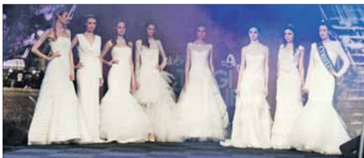
Wkrótce na naszglaspoznanski.pl bilety na Targi Ślubne.

Więcej informacji: www.targi-slubne.pl . Aleksandra Ambrożek