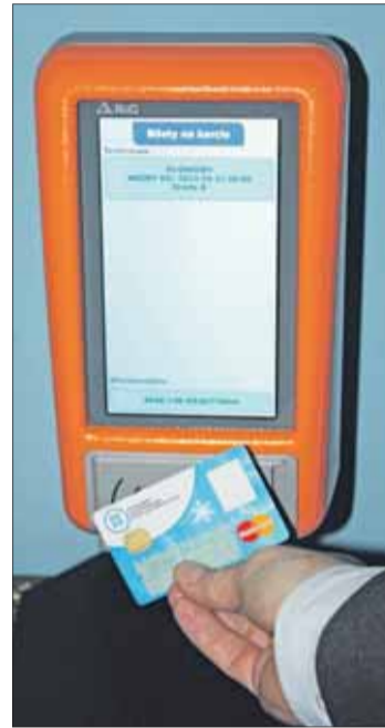
Kartę będzie należało przykładać do czytnika.

Korzystniejsze dla pasażerów mają być dłuższe przejazdy. Po częściowym odejściu od biletów „czasowych” obowiązywać mają „przystankowe”. Najdroższy ma być przejazd na krótkich odcinkach; np. opłata za przejazd pierwszego przystanku wyniesie ma 60 groszy, a drugiego i trzeciego – 50 gr, ale już czwartego i piątego – 34 gr, a szóstego i siódmego 26 gr. Jeszcze mniej zapłacić mamy, gdy dojedziemy do ósmego i dziewiątego przystanku – 12 gr, od dziesiątego przystanku i kolejnych przejazd ma być najtańszy – 8 gr. W projekcie uwzględniony ma być też czas związany z przesiadkami. Tu system PEKA zakłada, że limit ten wyniesie 20 minut. Jeżeli więc w tym czasie zdążymy się przesiąść np. z autobusu do tramwaju lub odwrotnie,