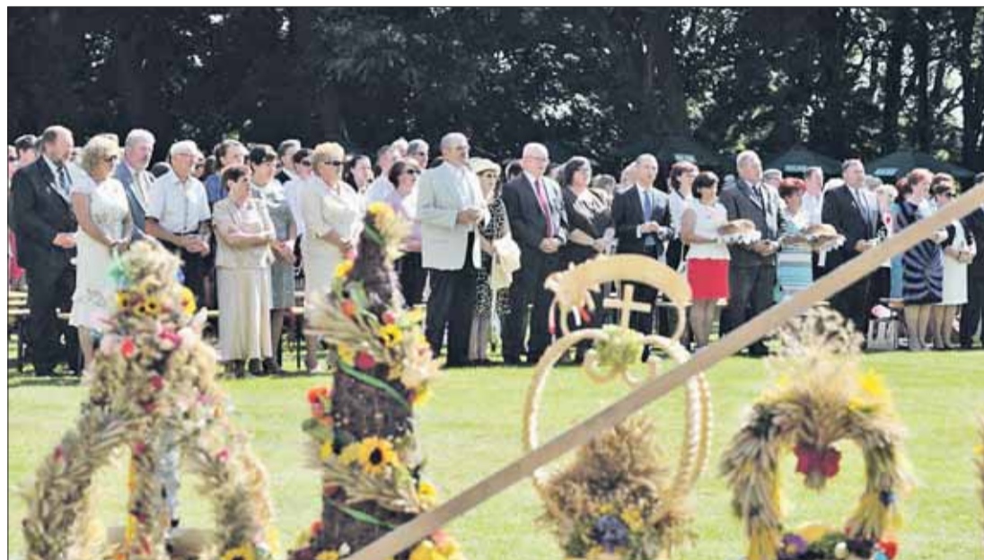
W Krześlicach zgromadziły się tłumy na czele z władzami samorządowymi.

Niemal we wszystkich gminach podziękowano za tegoroczne plony. Dożynki były też okazją do zabawy