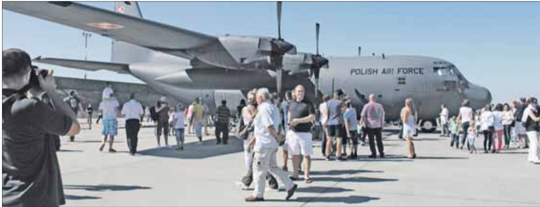
Można było podziwiać najnowsze wyposażenie polskiego lotnictwa.

Wszyscy przybyli goście mieli możliwość podziwiania eksponatów muzealnych takich jak Mig 21, MIG 19, Lim 19, Iskra, jak i statków powietrznych, m.in: Herkules C-130, Su-22 oraz historyczny Albatros. Były pokazy skoków spadochronowych, wystawa fotografii lotniczej i historycznych strojów wojskowych. AK, MC