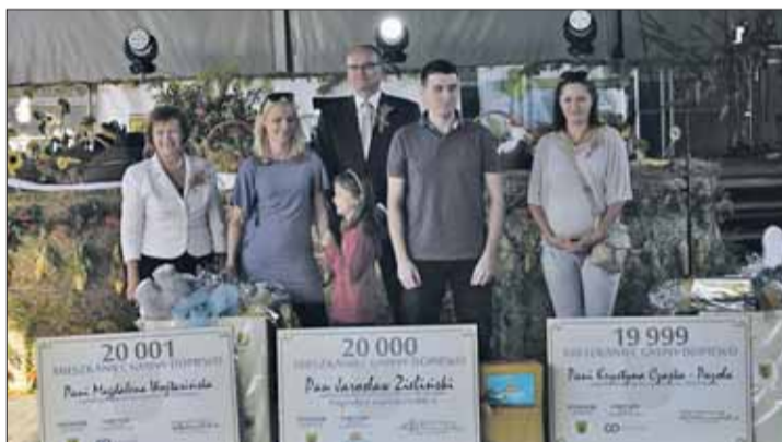
Laureaci akcji meldunkowej gminy Dopiewo.