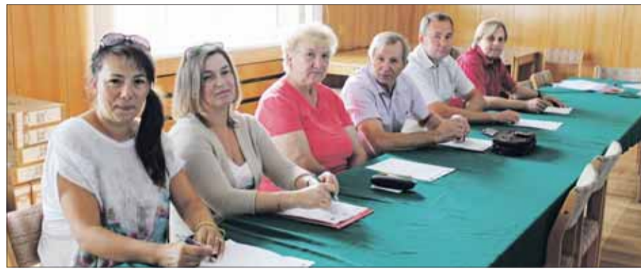
Przedstawiciele jednostek podległych gminie zestawy komputerowe otrzymali 28 sierpnia.

tury, Urząd Miejski Gminy i Ośrodek Pomocy Społecznej. Program ten to szansa dla wielu rodzin na korzystanie z komputera w celu zdobycia informacji niezbędnych np. do nauki w szkole, a także poszukiwania miejsc pracy i oczywiście do rozrywki. Red