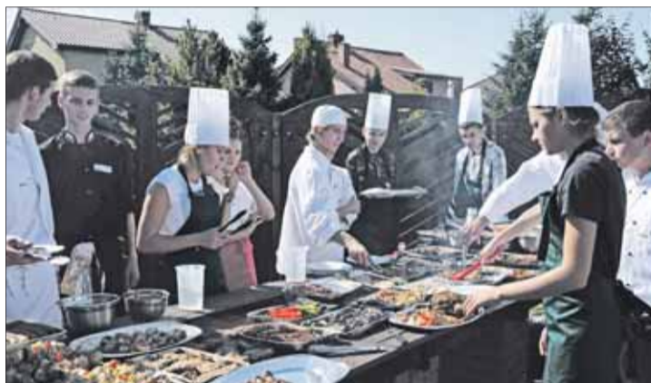
Wielkie grillowanie odbyło się w Swarzędzu.

W trakcie imprezy uczniowie podzielili na zespoły przygotowywali potrawy, które następnie zostały ocenione w konkursie na najładniej podane i najsmaczniejsze danie z grilla. Oprócz tego w programie standardowo znalazły się bezpłatne porady dietetyków, badania profilaktyczne wykonywane przez pracowników