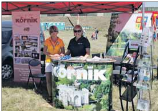
Gminy Kórnik i Mosina przygotowały stoiska promocyjne, które cieszyły się dużym zainteresowaniem.