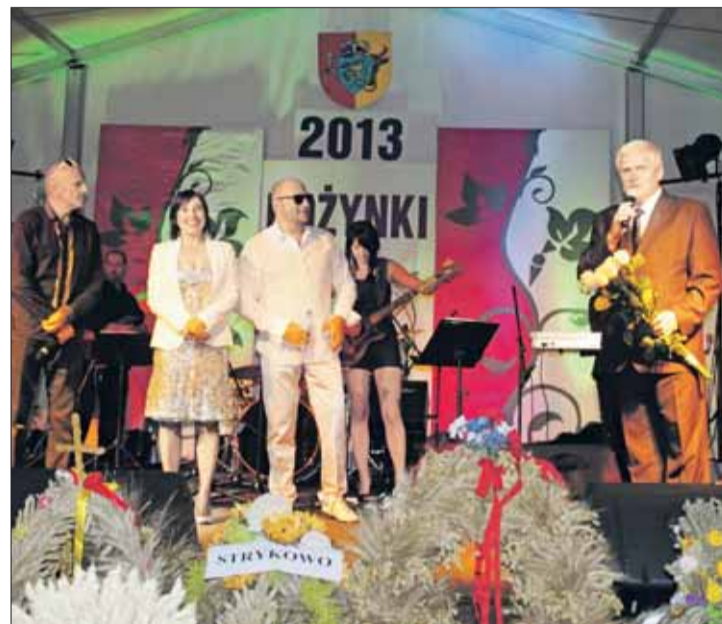
Gwiazdą dożynek gminy Stęszew był Tercet, czyli Kwartet.